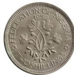
Рис. 3.2. 2 шиллинга 1959

Нигерия обрела независимость 1 октября 1960 без борьбы, унаследовав административные границы британской колонии 18 , а с ними – серьезный этнополитический раскол между севером и югом, дисбалансы в распределении ресурсов, власти и доходов между регионами, коррупцию и бандитизм. Нигерия быстро стала ареной схватки государств, стремившихся превратить ее формальный суверенитет в источник своего обогащения (Филиппов 2016).