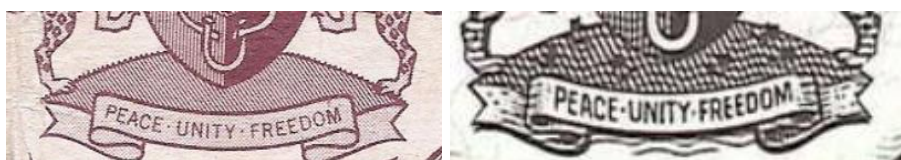
Рис. 7.6. Элемент герба на банкнотах Биафры 1967 и 1968.

Стоит отметить, что на банкноте Биафры в 1 фунт 1967 рассматриваемые элементы также отсутствуют - в отличие от банкнот второй серии 1968: