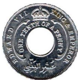
Рис. 2.1. \frac{1}{10} пенни 1907

В 1906 протекторат Южная Нигерия был объединен с колонией Лагос. В 1907 в денежное обращение введен британский западноафриканский фунт по курсу 1 к 1 к фунту стерлингов Великобритании: появились первые монеты в \frac{1}{10} и 1 пенни.