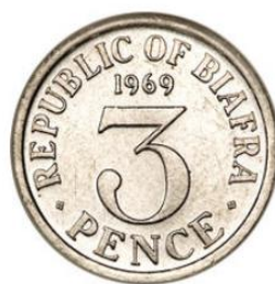
Рис. 4.1. 3 пенса 1969