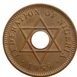
Рис. 3.1. ½ пенни 1959