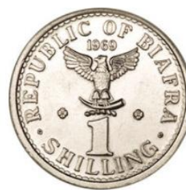
Рис. 4.2. 1 шиллинг 1969

Одновременно в обращение была введена серия монет 1969 из 3 номиналов: алюминиевые 3 пенса, 1 и 2 ½ шиллинга. На монетах были изображены официальные знаки и символы