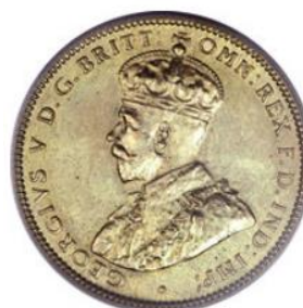
Рис. 2.2. 1 шиллинг 1920