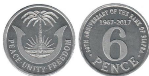
Рис. 6.2. 6 пенсов 2017

В 2012 состоялся выпуск первого токена в честь 45-летия создания Банка Биафры. Якобы он санкционирован т.н. Правительством Биафры в изгнании (BGIE) 60 . В сюжете токена используются элементы дизайна монет Биафры 1969.