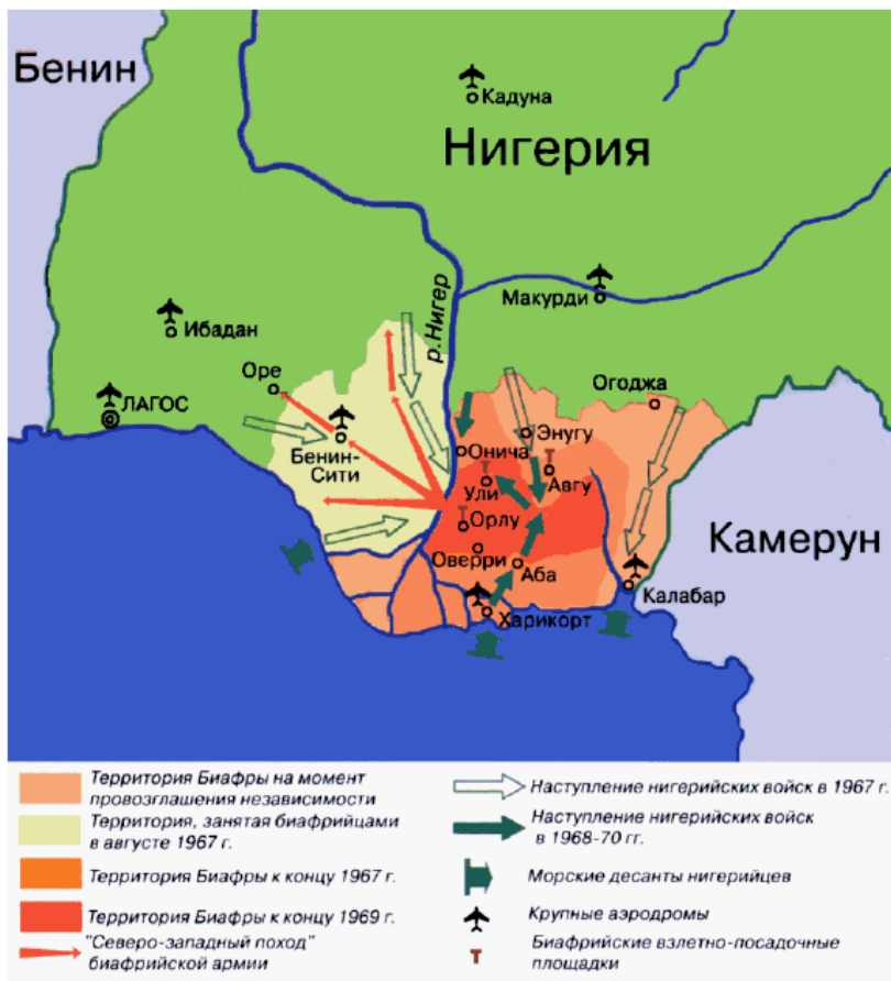
Рис. 4. Боевые действия во время гражданской войны в Нигерии (Жирохов 2002).

Руководство Биафры проводило параллели между борьбой игбо за независимость от Нигерии с борьбой за выживание государства Израиль 24 : чтобы не только сплотить разнородное полиэтническое население, но и оказать воздействие на мировое сообщество.