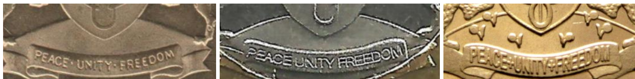
Рис. 7.5. Элемент герба на токенах под именем Биафры 2012-2021

На токенах элементы либо отсутствуют, либо представляют собой 6 цветков: