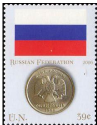
Рис. 18. Почтовая марка ООН «Монеты и флаги. Российская Федерация» 2006

В октябре 2006 в Нью-Йорке тиражом по 125 тыс. экземпляров выпущены 8 почтовых марок с изображениями национальных флагов и монет Австралии, Ганы, Израиля, Камбоджи, Китайской Народной Республики, Мексики, Российской Федерации и Японии.