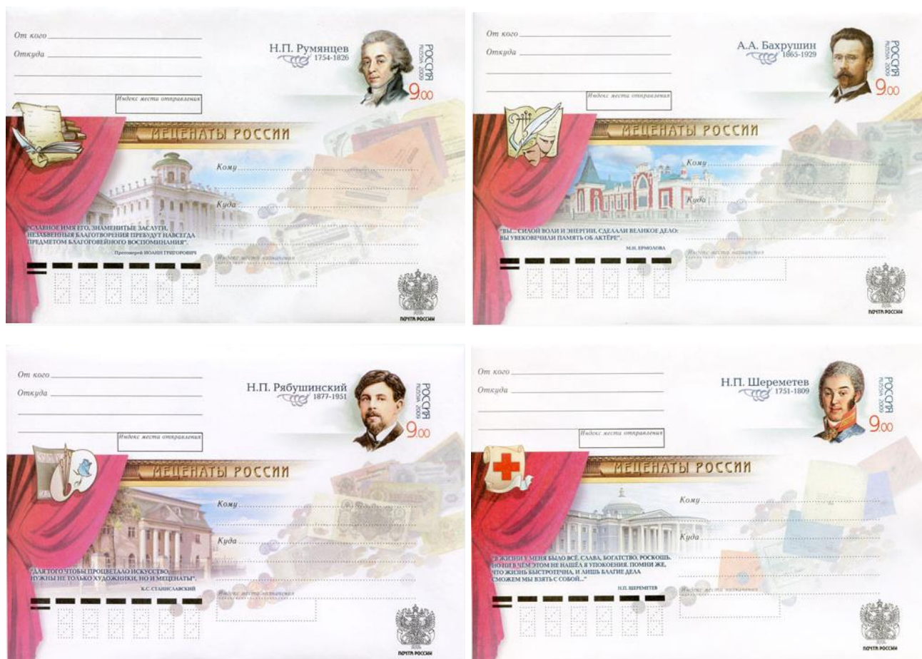
Рис. 10.2. Серия ХМК России «Благотворители и меценаты России» 2009

Тираж 4 ХМК, выпущенных в 2009, уменьшен до 57 тыс. экземпляров, а номинал марок вырос до 9 рублей.