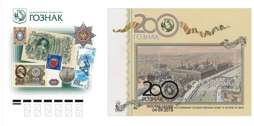
Рис. 13.1. КПД России «200 лет Гознаку России» 2018

На почтовой марке и полях блока изображены корпуса Экспедиции заготовления государственных бумаг (ЭЗГБ) в начале XX века.