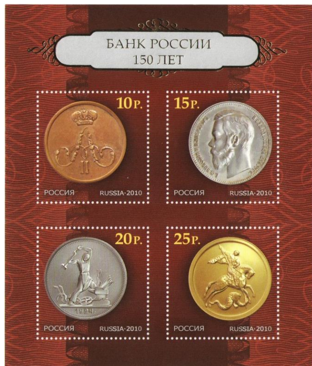
Рис. 11. Почтовый блок России «150 лет Банку России» 2010

В сентябре 2010 тиражом 120 тыс. экземпляров выпущен почтовый блок в честь 150-летия Банка России 22 . Государственный банк Российской империи был основан в 1860 Указом императора Александра II в целях упрочения денежной кредитной системы. В настоящее время преемником банка является Центральный банк Российской Федерации.