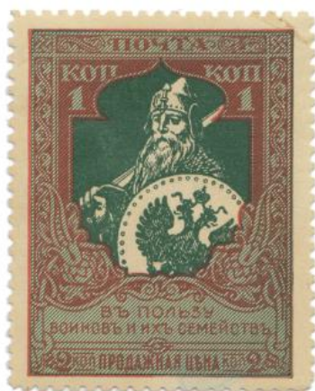
Рис. 1. Почтово-благотворительная марка РИ «В пользу воинов и их семейств» 1914

Цена продажи каждой марки состояла из номинальной стоимости и дополнительного сбора в 1 копейку в пользу сирот воинов действующей армии. После Октябрьской Революции 1917 продажа «патриотических» марок РИ была прекращена, однако, эти марки продолжительное время находились в почтовом обращении.