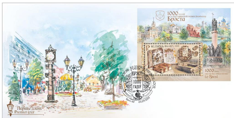
Рис. 15.1. КПД Беларуси «1000 лет первому письменному упоминанию Бреста» 2019

На полях блока и на КПД изображены основные достопримечательности Бреста.