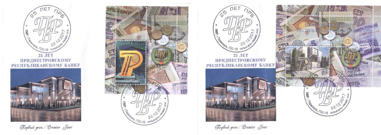
Рис. 17.2. КПД ПМР «25 лет Приднестровскому Республиканскому Банку» 2017

На КПД помещена ночная фотография здания ПРБ, сделанная еще в 2006-2007: