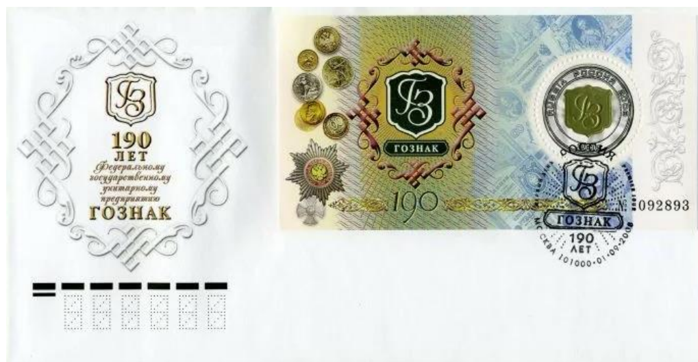
Рис. 9.1. КПД России «190 лет Гознаку России» 2008 и 2 варианта штемпеля

Кроме того, были выпущены КПД и памятный буклет, включавший почтовый блок с увеличенным полем.