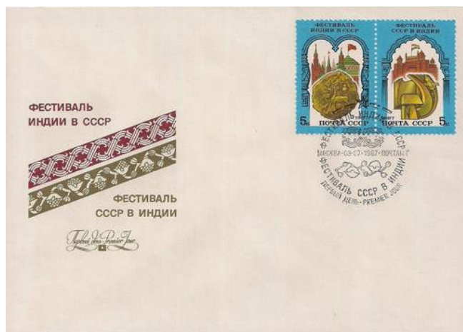
Рис. 4.2. КПД СССР «Фестивали советско-индийской дружбы» 1987