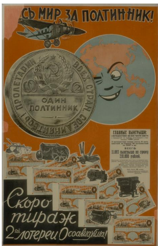
Рис. 2.1. Агитационный плакат СССР «Весь мир за полтинник!» 1928 с изображением серебряного полтинника (50 копеек) СССР 1924-27

Тем не менее, авторы дизайна советских агитационных плакатов, открыток и почтовых карточек 1920-30-х годов, разъясняющих и пропагандирующих преимущества сберегательных вкладов и денежно-вещевых лотерей, старались обходиться без изображений монет и банковских билетов. Они встречаются лишь изредка (рис. 2.1-2.2.) 7 .