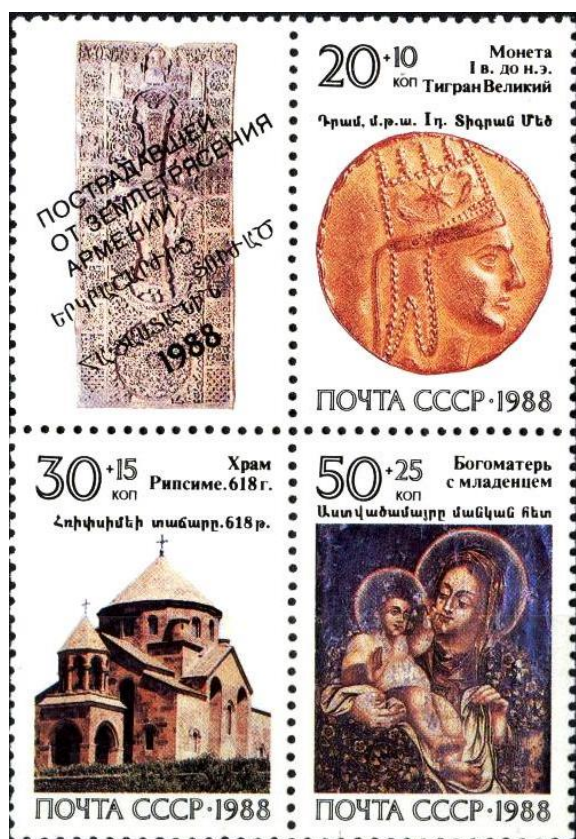
Рис. 5. Квартблок СССР «Реликвии армянского народа» 1988

В конце декабря 1988 тиражом 5 млн. экземпляров состоялся экстренный почтово-благотворительный выпуск квартблока с купоном в помощь населению Армении, пострадавшему от разрушительного землетрясения в Спитаке (Армянская ССР) 15 .