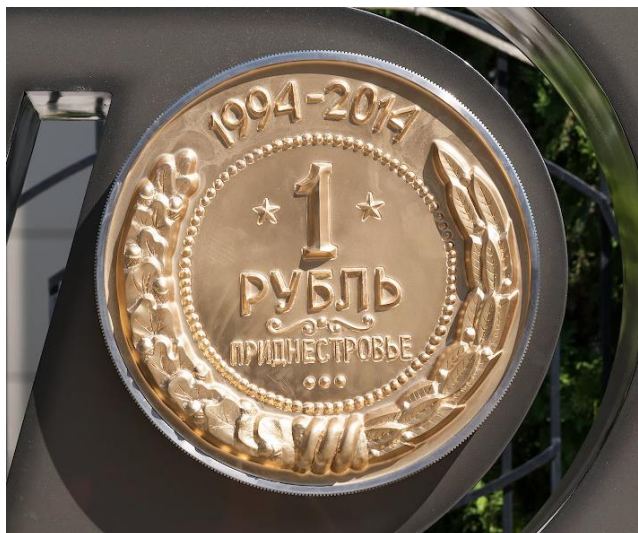
Рис. 17.1. Памятник «Приднестровский рубль» в Тирасполе (фотографии https://besarab.su , 2014)

На КПД помещена ночная фотография здания ПРБ, сделанная еще в 2006-2007: