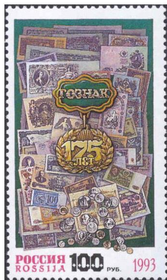
Рис. 6. Почтовая марка России «175 лет Гознаку» 1993

Сейчас Гознак России - крупнейшее государственное предприятие по производству государственных знаков, специальных видов бумаги, банкнот, бланков документов и ценных бумаг, акцизных, специальных и почтовых марок, монет, орденов и медалей.