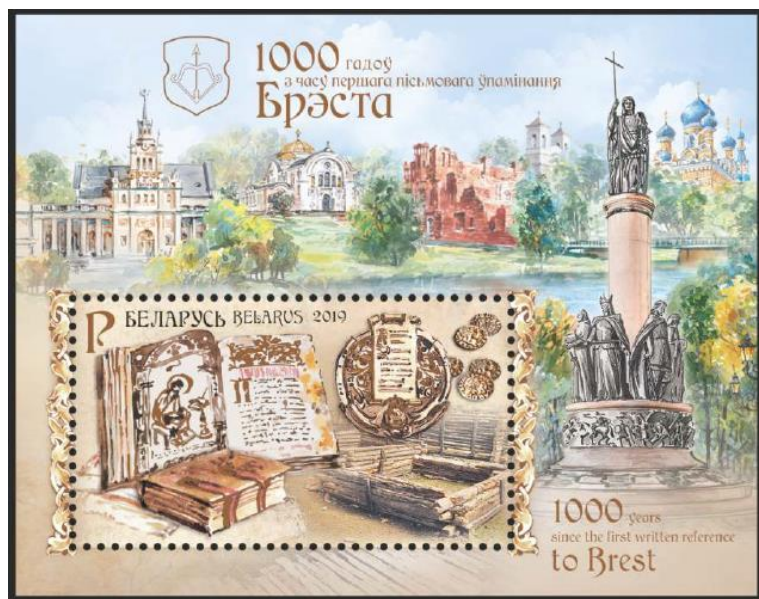
Рис. 15. Почтовый блок Беларуси «1000 лет первому письменному упоминанию Бреста» 2019

В сентябре 2019 тиражом 20 тыс. экземпляров выпущен почтовый блок в честь 1000-летия со времени первого письменного упоминания Бреста (Беларусь) 29 .