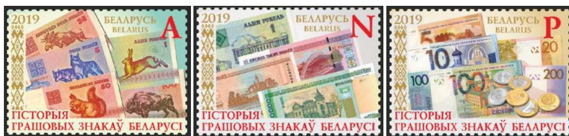
Рис. 16. Почтовые марки Беларуси «История денежных знаков Беларуси» 2019

В ноябре 2019 выпущена тематическая серия «История денежных знаков Беларуси» из 3 почтовых марок тиражом 72 тыс. экземпляров, 4 малых листов тиражом 15 тыс. штук и 3 карт-максимумов 32 .