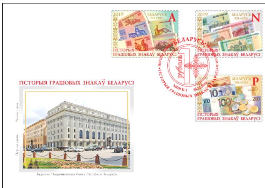
Рис. 16.1. КПД Беларуси «История денежных знаков Беларуси» 2019

На КПД помещена фотография здания Национального банка Республики Беларусь в Минске. Штемпель красного цвета содержит стилизованное изображение монеты Беларуси номиналом 1 рубль образца 2009.