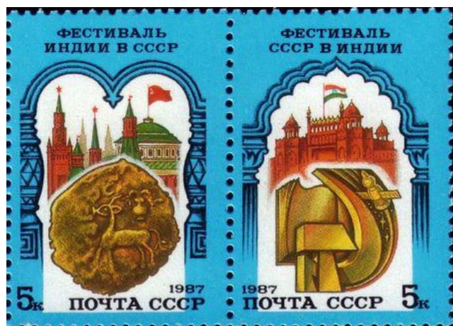
Рис. 4. Сценка из 2 почтовых марок СССР «Фестивали советско-индийской дружбы» 1987

В июле 1987 тиражом 2 млн. экземпляров была выпущена сценка из 2 почтовых марок в честь фестивалей советско-индийской дружбы 10 . К середине 1980-х отношения между СССР и Индией достигли максимальной близости. Итогом в сфере культуры стало уникальное мероприятие – фестиваль советско-индийской дружбы, проводившийся в 1987 в городах СССР, а в 1988 - в городах Индии.