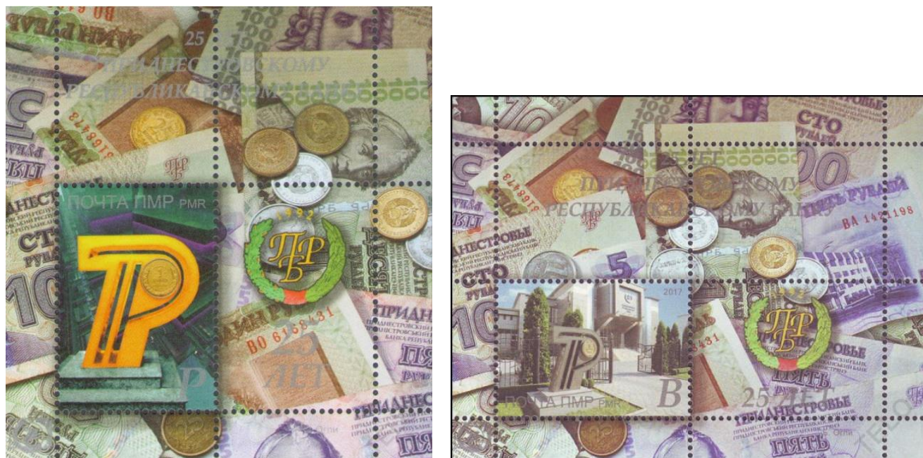
Рис. 17. Почтовые блоки ПМР «25 лет Приднестровскому Республиканскому Банку» 2017

Долгое время изображения денежных знаков на почтовых марках ПМР не встречались. В декабре 2017 выпущена серия «25 лет Приднестровскому Республиканскому Банку» из 2 почтовых блоков тиражом 700 экземпляров каждый 34 .