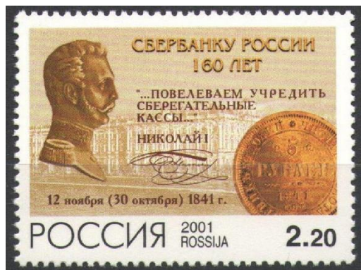
Рис. 7. Почтовая марка России «160 лет Сбербанку России» 2001

Первые сберегательные кассы основаны в России в 1841 Указом императора Николая I и открылись в 1842 при Московской и Санкт-Петербургской сохранных казнах. Сегодня Сбербанк — крупнейший банк в России, Центральной и Восточной Европе, один из ведущих международных финансовых институтов.