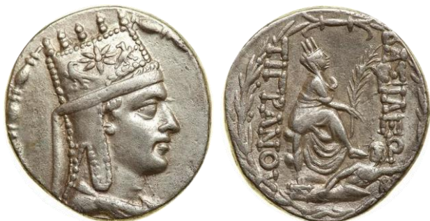
Рис. 5.4. Серебряная тетрадрахма Тиграна II Великого (I век до н.э.)

Бронзовые и серебряные монеты Тиграна II чеканили в столице государства Селевкидов, Антиохии на Оронте, после завоевания Сирии в I веке до н.э. (рис. 5.4).