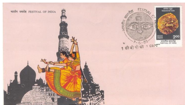
Рис. 4.3. КПД Индии «Монета Яудхеи. Фестиваль Индии» 14 1985