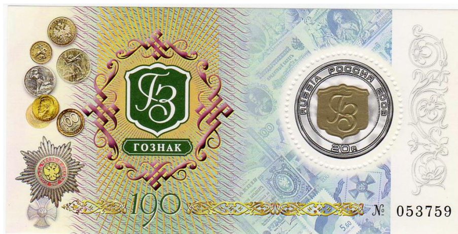
Рис. 9. Почтовый блок России «190 лет Гознаку России» 2008

В сентябре 2008 тиражом 120 тыс. экземпляров выпущен почтовый блок в честь 190-летия Гознака России 19 .