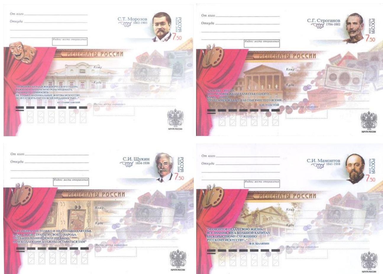
Рис. 10.1. Серия ХМК России «Благотворители и меценаты России» 2008

Тираж 4 ХМК, выпущенных в 2008, составил 105 тыс. экземпляров, номинал марок - 7,5 рублей.