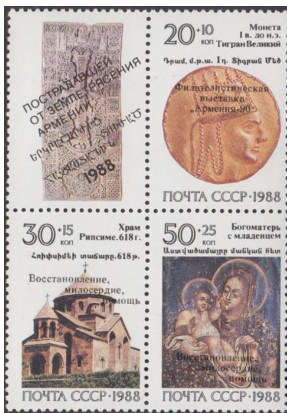
Рис. 5.1. Квартблок СССР «Реликвии армянского народа» 1988 с надпечатками «Филателистическая выставка «Армения-90» и «Восстановление, милосердие, помощь»

На почтово-благотворительных марках изображены реликвии армянского народа: