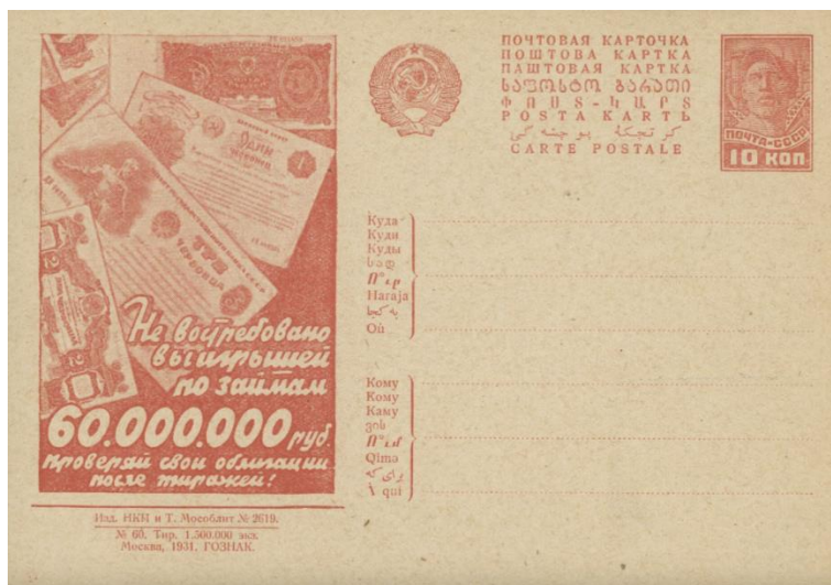
Рис. 2.2. Почтовая карточка СССР «Не востребовано выигрышей по займам...» 1931 с изображением банковских билетов в 5, 10, 20 и 30 рублей 1924-28

Эти традиции в советской филателии сохранились вплоть до конца 1980-х. Изображения монет на марках и филателистических конвертах СССР помещались чрезвычайно редко, а изображения советских монет или банкнот вовсе отсутствуют.