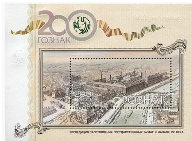
Рис. 13. Почтовый блок России «200 лет Гознаку России» 2018

В сентябре 2018 тиражом 45 тыс. экземпляров выпущен почтовый блок в честь 200-летия Гознака 24 .