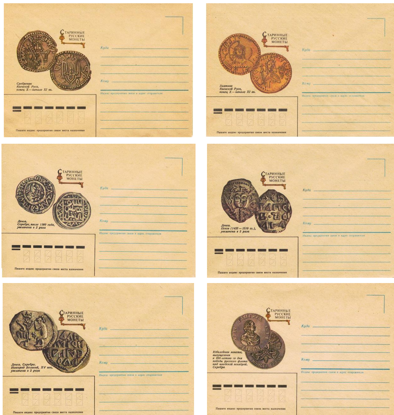
Рис. 3. Серия ХНК СССР «Старинные русские монеты» 1986

В 1986 была выпущена серия «Старинные русские монеты» из 6 художественных немаркированных конвертов (ХНК) 8 .