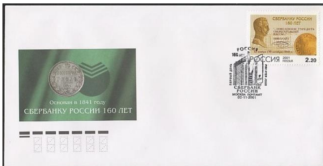
Рис. 7.1. КПД России «160 лет Сбербанку России» 2001

На марке изображена золотая монета Николая I 1841 номиналом 5 рублей, на КПД - серебряный рубль Николая I 1841.