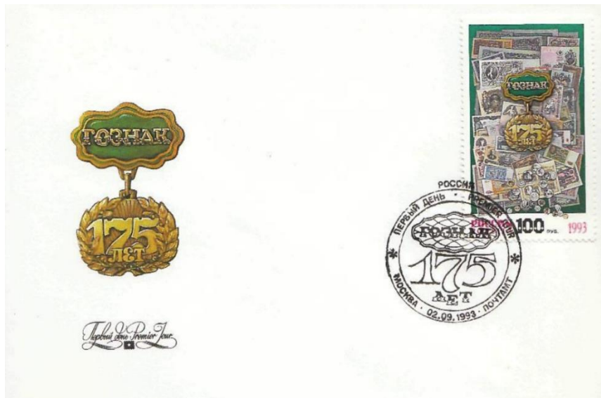
Рис. 6.1. КПД России «175 лет Гознаку» 1993

На почтовой марке изображены стилизованные российские и советские монеты и банкноты разных периодов XX века.