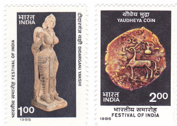
Рис. 4.1. Почтовые марки Индии «Якшини из Дидарганджа» и «Монета Яудхеи» 1985

На почтовой марке «Фестиваль Индии в СССР, приуроченный к 40-летию независимости Индии» изображена медная монета Яудхеи 11 (II век) на фоне ансамбля московского Кремля в обрамлении арки в русском национальном стиле.