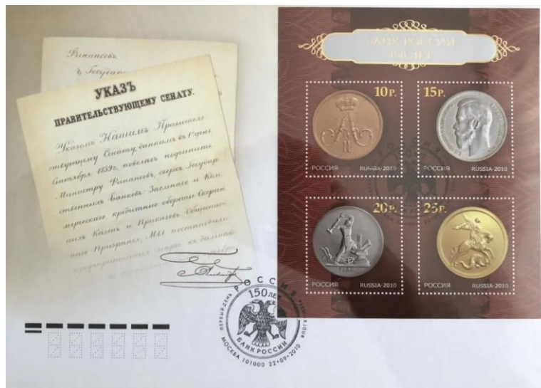
Рис. 11.1. КПД России «150 лет Банку России» 2010