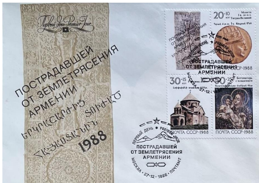
Рис. 5.2. КПД СССР «Реликвии армянского народа» 1988