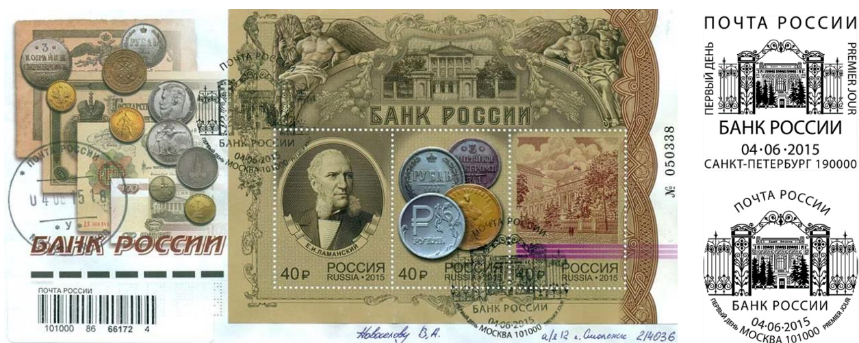
Рис. 12.1. КПД России «155 лет Банку России» 2015 и 2 варианта штемпеля

На КПД изображены российские и советские монеты XX века, а также элементы банковских билетов номиналом 100 рублей разных периодов.