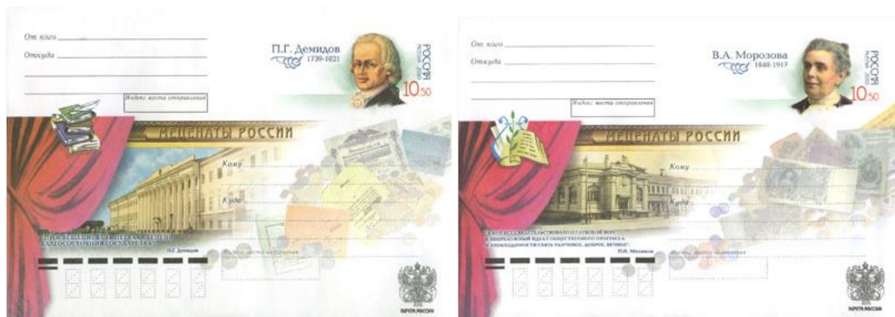
Рис. 10.3. Серия ХМК России «Благотворители и меценаты России» 2010

На марках изображены Николай Юсупов (*1751-†1831), Павел Третьяков (*1832-†1898), Павел Демидов (*1739-†1821), Варвара Морозова (*1848-†1917).