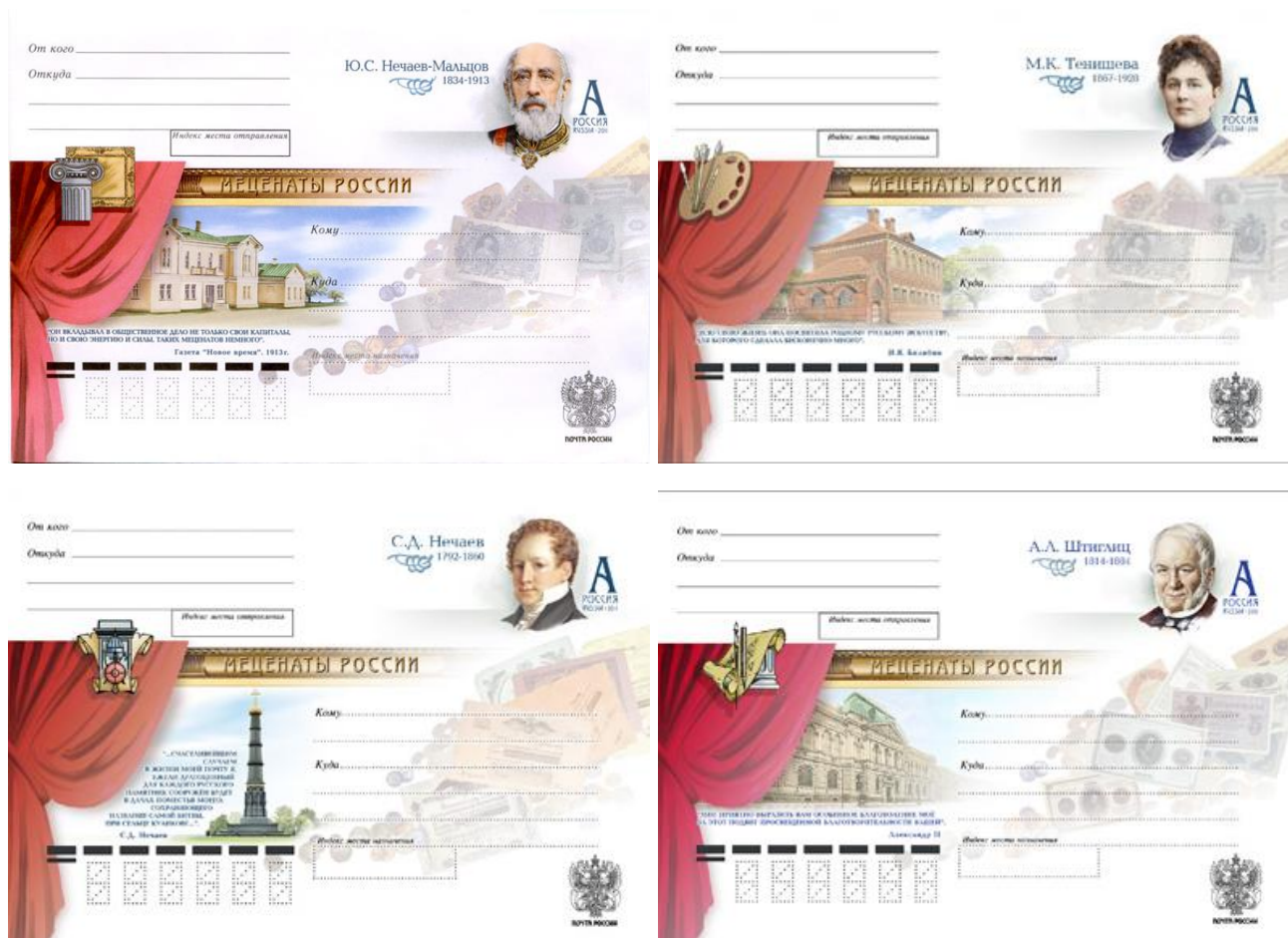
Рис. 10.4. Серия ХМК России «Благотворители и меценаты России» 2011

Для 4 ХМК, выпущенных в 2011, марка получила литерный номинал «А» 21 , что позволило увеличить тираж каждого конверта до 500 тыс. экземпляров.