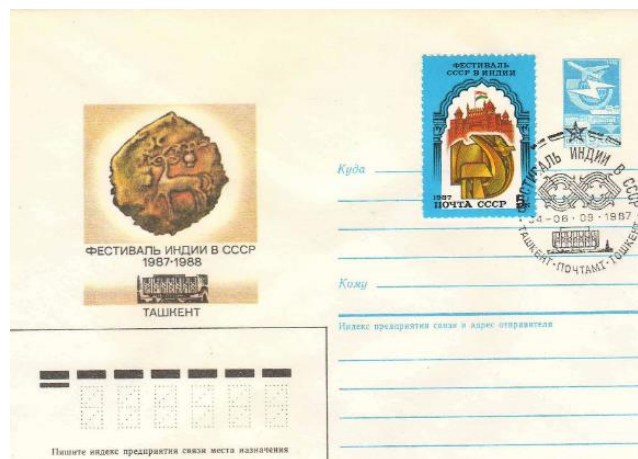
Рис. 4.4. Варианты ХМК СССР «Фестивали советско-индийской дружбы» 1987

В каждом из 3 городов использовался свой вариант штемпеля черного цвета, а в Москве – дополнительный штемпель красного цвета к открытию фестиваля (рис. 4.4).