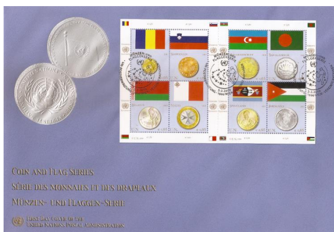
Рис. 19.1. Варианты КПД ООН «Монеты и флаги» 2010