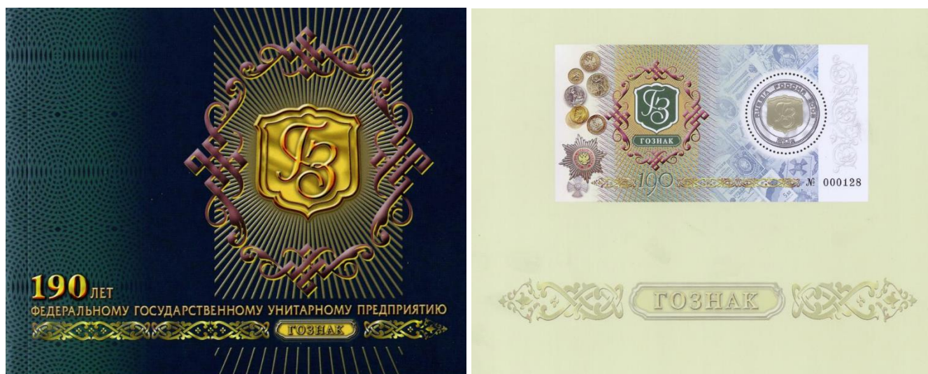
Рис. 9.2. Обложка памятного буклета и вариант почтового блока России «190 лет Гознаку России» 2008