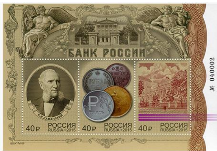
Рис. 12. Почтовый блок России «155 лет Банку России» 2015

В июне 2015 тиражом 70 тыс. экземпляров выпущен почтовый блок в честь 155-летия Банка России 23 .