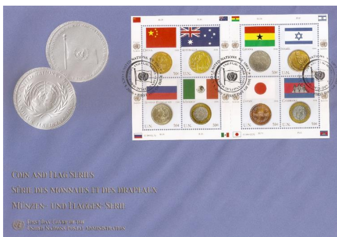
Рис. 18.1. Варианты КПД ООН «Монеты и флаги» 2006