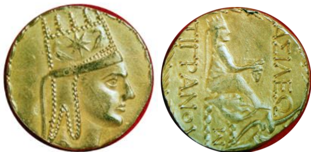
Рис. 5.3. Имитация тетрадрахмы Тиграна II Великого (1960-е)

Бронзовые и серебряные монеты Тиграна II чеканили в столице государства Селевкидов, Антиохии на Оронте, после завоевания Сирии в I веке до н.э. (рис. 5.4).