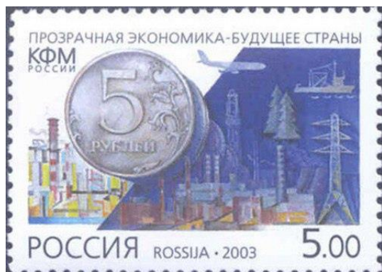
Рис. 8. Почтовая марка России «Комитет РФ по финансовому мониторингу» 2003

Этой деятельностью с 2001 занимается Комитет Российской Федерации по финансовому мониторингу (КФМ России). В 2004 КФМ преобразован в Федеральную службу по финансовому мониторингу (Росфинмониторинг).