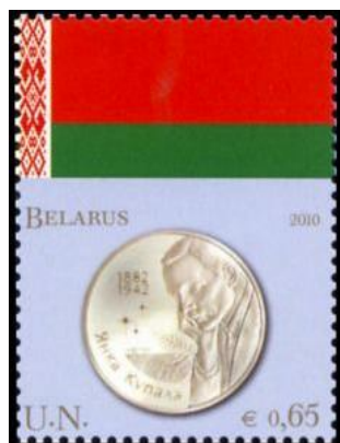
Рис. 19. Почтовая марка ООН «Монеты и флаги. Беларусь» 2010

В феврале 2010 в Вене тиражом по 88 тыс. экземпляров выпущены 8 почтовых марок с изображениями национальных флагов и монет Азербайджана, Бангладеш, Беларуси, Иордании, Мальты, Румынии, Свазиленда и Словении.