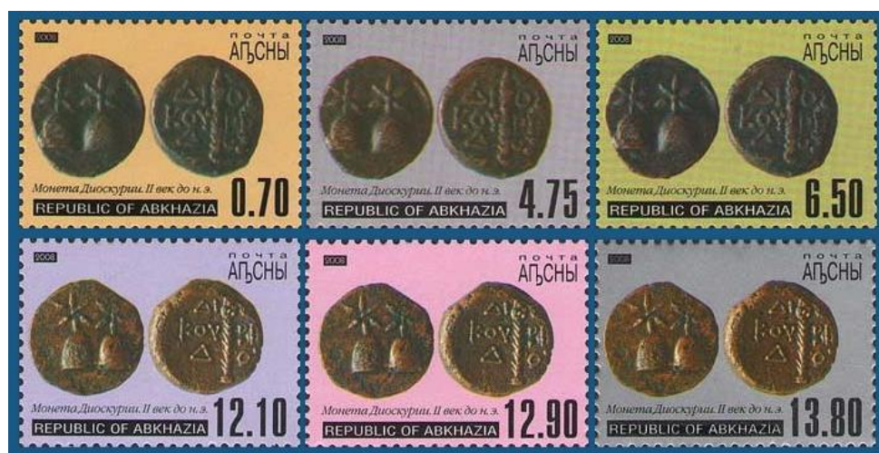
Рис. 14. Почтовые марки Абхазии «Монеты Диоскурии» 2008

В декабре 2008 выпущена серия из 6 марок с изображением 2 монет древней Диоскуриады.