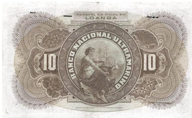
Рис. 3.2. Реверс банкноты Португальской Анголы в 10 000 реалов 1909

С ноября 1914 в обращении находились банкноты ВНУ номиналами 10, 20 и 50 сентаво с надпечатками «LOANDA» («Луанда», порт.) разных цветов. Серия изготовлена компанией Bradbury, Wilkinson & Co (BWC) (Великобритания). Кроме того, параллельно обращались банкноты в 50 сентаво, которые ВНУ выпускал для колонии Португальского Сан-Томе и Принсипи, но с надпечатками «Pagavel na Filial de Loanda» или просто «Loanda».