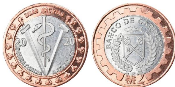
Рис. 7.2. Токен Кабинды в 2 макуты 2020

Морская фауна и животный мир – основные мотивы в дизайне токенов под именем Кабинды. В качестве прообразов для основных элементов дизайна использованы общедоступные фотографии, рисунки известных художников-анималистов, сюжеты почтовых марок Анголы, Португальской Анголы и Португальского Мозамбика разных лет. Неоднократно выпускались токены необычной формы: треугольник, четырехугольник, шестиугольник, восьмиугольник.