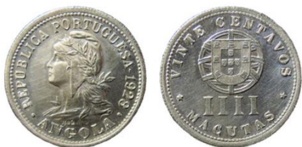
Рис. 4.5. Монета Португальской Анголы в 4 макуты / 20 сентаво 1929

В 1948 была выпущена серия монет номиналами 10, 20, 50 сентаво с указанием государства «Colonia de Angola, Republica Portuguesa» («Колония Ангола, Португальская Республика», порт.) (рис. 4.6), а также серия банкнот номиналами 1 и 2.5 анголаров с указанием государства «Governo Geral de Angola, Republica Portuguesa» («Правительство Анголы, Португальская Республика», порт.). Вместо герба Португалии на монетах изображен герб колонии со слоном и зеброй.