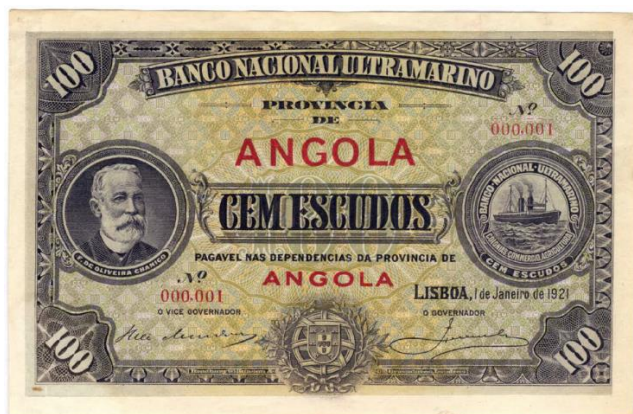
Рис. 4.3. Банкнота BNU в 100 эскудо для Португальской Анголы 1921 (Carvalho 2011)

К этим монетам добавлены банкноты номиналом 50 сентаво, 2 типа которых Верховный комиссариат Анголы (Alto Comissariado de Angola, порт.) выпускал в 1921 и 1923 17 (рис. 4.3-4.4). Во второй половине 1922 появилась серия банкнот BNU номиналами 1, 2,5, 5, 10, 20, 50 и 100 эскудо т.н. «эмиссии Чамиссо» 1921 (Carvalho 2011) 18 . Дизайн банкнот всех номиналов был универсальным, наименование колонии впечатывалось позже другим цветом. Банкноты эмиссии BNU аннулировали в декабре 1922.