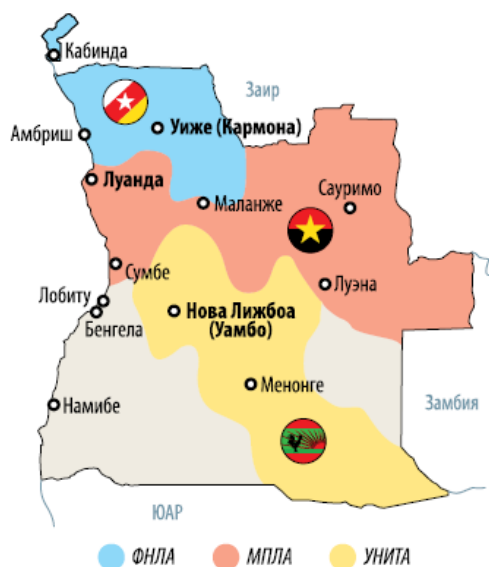
Рис. 5.2. Сферы влияния участников конфликта в Анголе в 1975 (Долматов 2021)

Особая роль в поддержке различных военно-политических движений Анголы и Кабинды в борьбе против MPLA принадлежит Португалии.