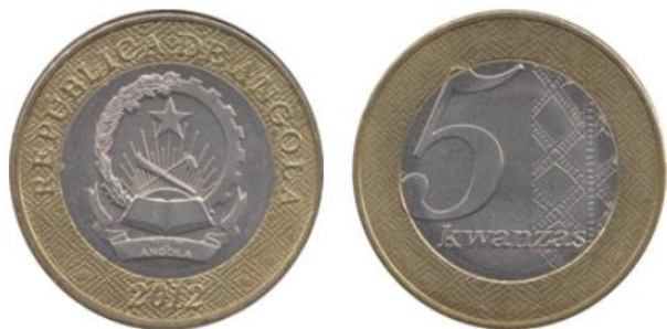
Рис. 6.3. Монета Анголы в 5 кванз 2012

Многомиллионными тиражами выпускались юбилейные монеты Анголы для денежного обращения: номиналом 20 кванз - в 2014, 50 и 100 кванз – в 2015, 200 кванз – в 2022 28 (рис. 6.4).