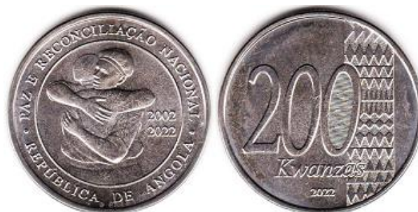
Рис. 6.4. Юбилейная монета Анголы «20 лет. Мир и национальное примирение» в 200 кванз 2022

В течение второго полугодия 2020 выпущены в параллельное обращение полимерные банкноты новой серии номиналом 200, 500, 1 000 и 2 000 кванз, а в январе 2021 - 5 000 кванз. Основные элементы дизайна – портрет первого президента Агостиньо Нето, «чудеса природы» и музыкальные инструменты Анголы. Банкноты предположительно изготовлены АО «Гознак» (Россия), Giesecke & Devrient (Германия) и Crane Currencies (США).