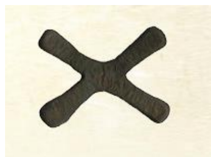
Рис. 1.5. Крест Катанги

В Западной Африке в качестве валюты имели широкое хождение ткани (Johnson 1980; Artica 2002). Именно ткани или ткани-монеты («ranos-moedas», порт.) заняли место основной валюты в Лоанго и Каконго после обесценения раковин в XVII веке (Martin 1986). Небольшие куски ткани квадратной формы изготавливали на основе волокон пальмовых листьев рафии (рис. 1.4). Ткани из Лоанго назывались «либонго» или «ликута» 11 . Для удобства обращения мбонго связывались в пачки по 4, 20 или 160 штук, каждая из которых имела свое название («bongos», «sangos», «infulas», порт.) (Rebello de Sousa 1967). Ткани из Каконго назывались «чистыми» и в зависимости от размера делились на «cundis» и «meios cundis». В Анголе расплачивались мбонго даже с солдатами португальского гарнизона (Randles 1968).