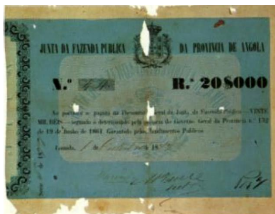
Рис. 2.4. Банкнота Португальской Анголы в 20 000 реалов 1861

В 1864 в Лиссабоне в качестве эмиссионного банка для португальских заморских территорий был основан Заморский Национальный Банк (Banco Nacional Ultramarino, BNU, порт.). А уже в следующем 1865 для развития банковской активности в Португальской Анголе был открыт филиал BNU в Луанде. Долгое время BNU сохранял монополию на выпуск банкнот в колониях Португалии.