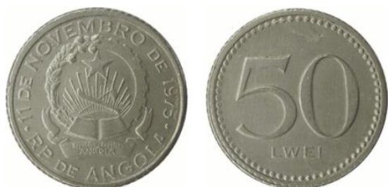
Рис. 6.1. Монета НРА в 50 лвей 1977

В июле 1993 введены в обращение новые номиналы банкнот в 50 000 и 100 000 новых кванз, в августе 1994 добавлен номинал в 500 000 новых кванз. В дизайне серии сохранены вдвоенные профили президентов Анголы Нето и душ Сантуша, использованы изображения природных достопримечательностей и представителей животного мира Анголы.