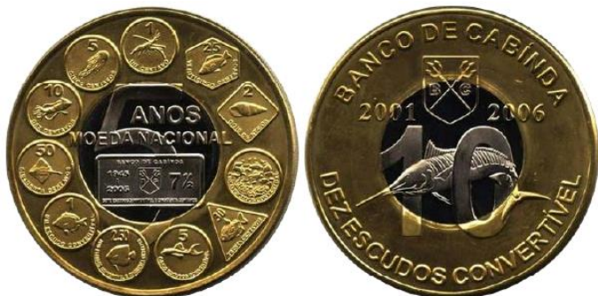
Рис. 7.1. Токен Кабинды в 10 эскудо 2006

Изготовление токенов рассчитано на спрос со стороны неискушенных коллекционеров монет в наиболее популярных сегментах: монеты с изображениями животного мира, биметаллические монеты, монеты необычной формы.