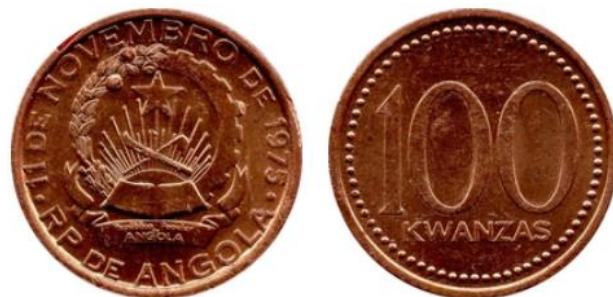
Рис. 6.2. Монета НРА в 100 кванз 1992

В условиях гиперинфляции в июле 1995 параллельно с новой кванзой в обращении появилась «скорректированная кванза» ( kwanza reajustado , порт.) по курсу 1 к 1 000. Были выпущены банкноты достоинством в 1 000, 5 000 и 10 000, к которым уже в апреле 1996 пришлось добавить новые номиналы в 50 000, 100 000, 500 000, 1 миллион и 5 миллионов «скорректированных кванз».