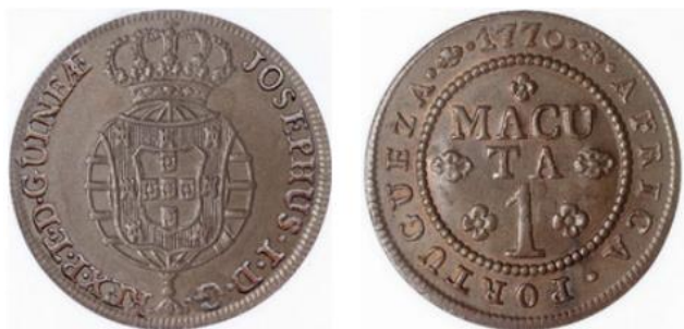
Рис. 2.1. Монета Португальской Анголы в 1 макуту 1770

Первые собственно ангольские монеты, отличавшиеся по дизайну от бразильских, увидели свет в 1762. Валютой колонии стала макута, равная 50 реалам. Выпускались медные монеты в 5 реалов 14 , ¼, ½ и 1 макуту (рис. 2.1), серебряные монеты в 2, 4, 6, 8, 10 и 12 макут с указанием государства «Africa Portugueza» («Португальская Африка», порт.) (рис. 2.2).