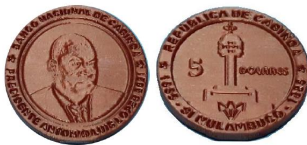
Рис. 7.4. Токен Кабинды в 5 долларов 2021

В 2013-2014 в продаже появилась серия из 6 сувенирных билетов под именем Кабинды. Заказчик, производитель и тираж серии неизвестны. Качество изготовления билетов – низкое. В дизайне сувенирных билетов использована фотография балкера «Paris Y» (Сьерра-Леоне) у причала Феодосийского морского торгового порта (Крым) в 2011, а также общедоступные рисунки рыб, обитающих в водоёмах Евразии, Северной Америки, в северной части Атлантического океана.