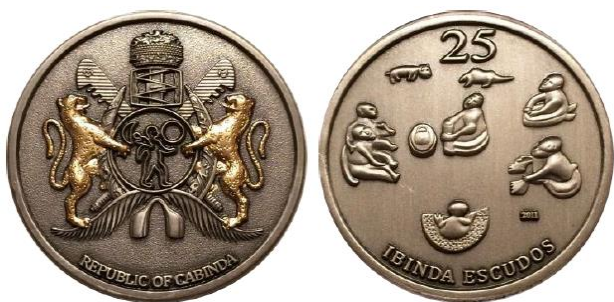
Рис. 7.3. Токен Кабинды в 25 ибинда эскудо 2011