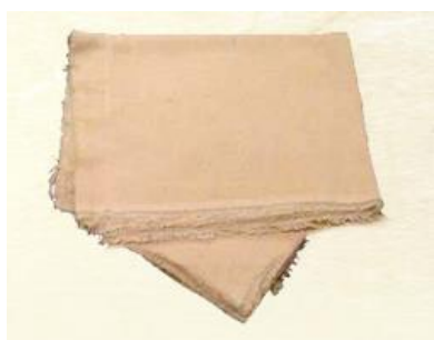
Рис. 1.4. Ткани-монеты