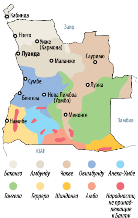
Рис. 5.1. Карта этнических групп Анголы в 1975-76 (Долматов 2021)

Вооруженный конфликт между движениями за независимость Анголы, спровоцированный несовпадением целей и опорой на различные этнические базы, начался в феврале 1975 (рис. 5.1-5.2).