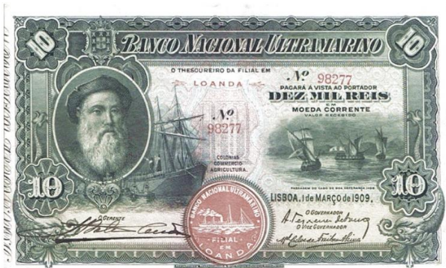
Рис. 3.1. Аверс банкноты Португальской Анголы в 10 000 реалов 1909