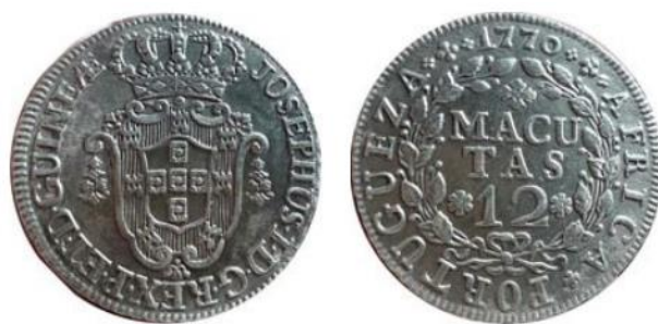
Рис. 2.2. Монета Португальской Анголы в 12 макут 1770

В начале XIX века в обращении на территории Португальской Анголы находились медные монеты в ¼, ½ и 1 макуту, серебряные монеты в 2, 4, 6, 8, 10, 12 макут серий 1783-96 королевы Марии I (*1734-†1816).