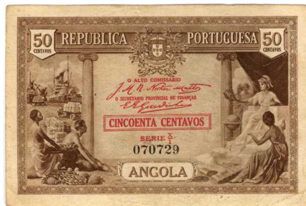
Рис. 4.4. Банкнота в 50 сентаво для Португальской Анголы 1923 (Carvalho 2011)

Экономические трудности межвоенного периода в Португалии вкупе с бесконтрольной эмиссией привели финансовую ситуацию в колонии к полнейшему хаосу. Власти метрополии усиливают давление на возникшие еще до Первой мировой войны среди «асимиладуш» (мулатов и «цивилизованных» чернокожих ангольцев) общественные организации антиколониальной направленности: в 1922 под запрет попала Ангольская лига, выступавшая за улучшение условий труда «индиженуш» (коренного населения внутренних провинций) (Полонский 2015).