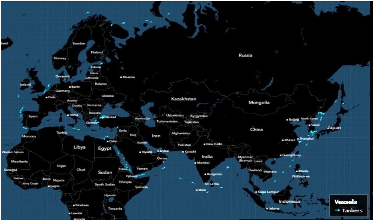
Карта движения "Совкомфлот" за последние 30 дней.

И теперь танкеры "Совкомфлот" нацелены на такие страны, как Индия и Китай, которые не присоединились к ценовому потолку