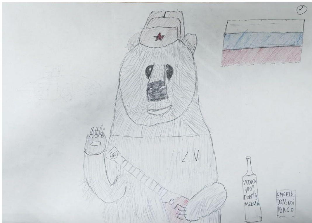
Рисунок 3 – Непривлекательная иллюстрация образа будущего