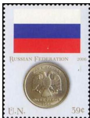
Рис. 19. Почтовая марка ООН «Монеты и флаги. Российская Федерация» 2006

В октябре 2006 в Нью-Йорке тиражом по 125 тыс. экземпляров выпущены 8 почтовых марок с изображениями национальных флагов и монет Австралии, Ганы, Израиля, Камбоджи, Китайской Народной Республики, Мексики, Российской Федерации и Японии.