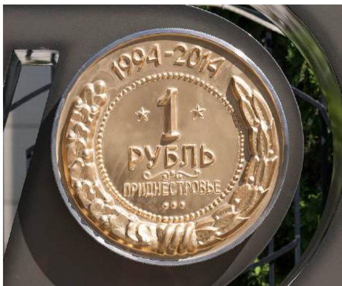
Рис. 18.1. Памятник «Приднестровский рубль» в Тирасполе (фотографии https://besarab.su , 2014)

На КПД помещена ночная фотография здания ПРБ, сделанная еще в 2006-2007 (рис. 18.2).