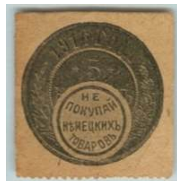
Рис. 1.3. Виньетка «Не покупай немецких товаров» 1916

В годы Первой мировой войны многочисленные виньетки и благотворительные непочтовые марки выпускались в разных городах РИ.