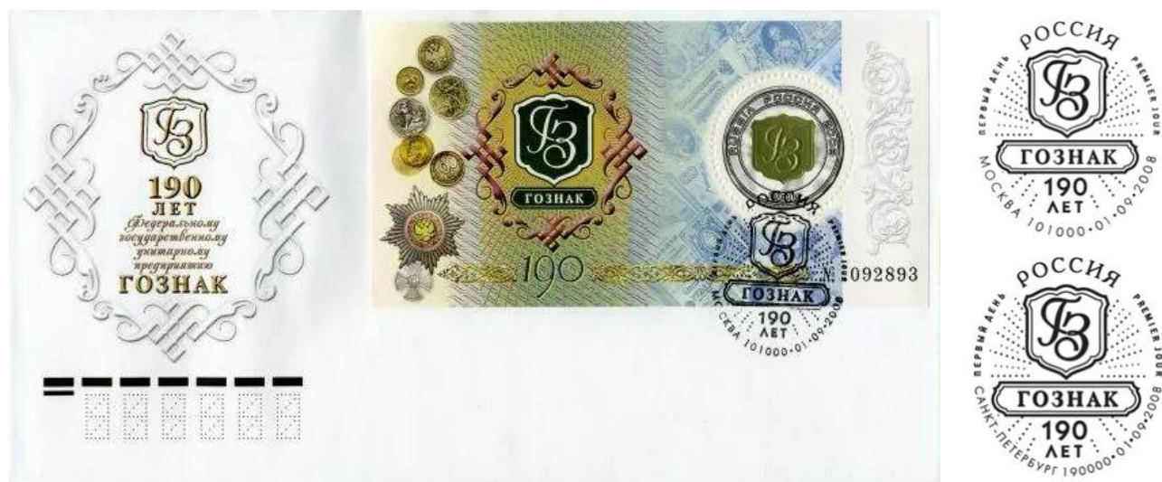
Рис. 9.1. КПД России «190 лет Гознаку России» 2008 и 2 варианта штемпеля

КПД с почтовым блоком были выпущены со штемпелями в 2 вариантах - для Москвы и Санкт-Петербурга (рис. 9.1).