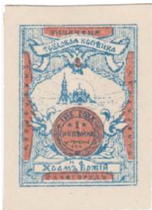
Рис. 1.1. Виньетка «На храм Божий. Славгород» 1912

В 1912 в Славгороде 8 неизвестной организацией издана виньетка 9 «На храм Божий. Славгород» с изображением медной копейки Николая II 1912 и слов «Уплачена трудовая копейка» (Недайводин 2010) (рис. 1.1).