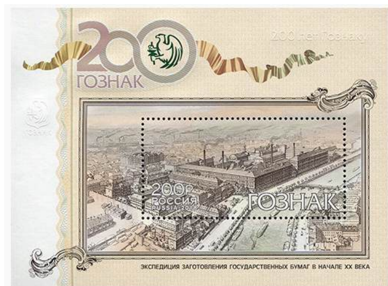
Рис. 13. Почтовый блок России «200 лет Гознаку России» 2018

В сентябре 2018 тиражом 45 тыс. экземпляров выпущен почтовый блок в честь 200-летия Гознака 29 (рис. 13).