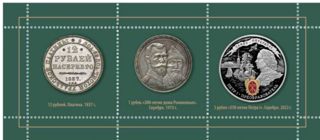
Рис. 14.2. Листок с виньетками «300 лет СПМД» 2024