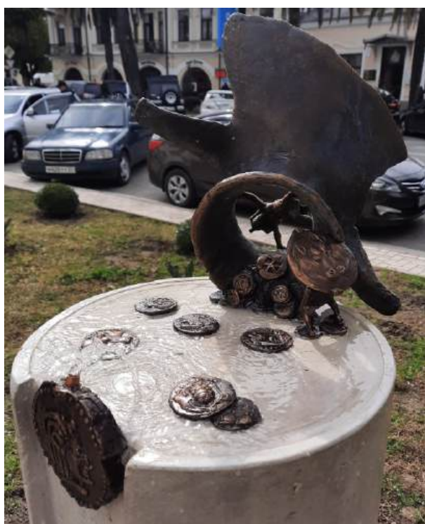
Рис. 15.1. Жанровая скульптура «Похищение монет ацанами» (фотография https://sukhumcity.info , 2023)

Медный халк можно увидеть среди стилизованных монет в питьевом фонтане «Похищение монет ацанами» 37 , установленном в феврале 2023 у здания Музея ИБ РА в Сухуме (рис. 15.1).