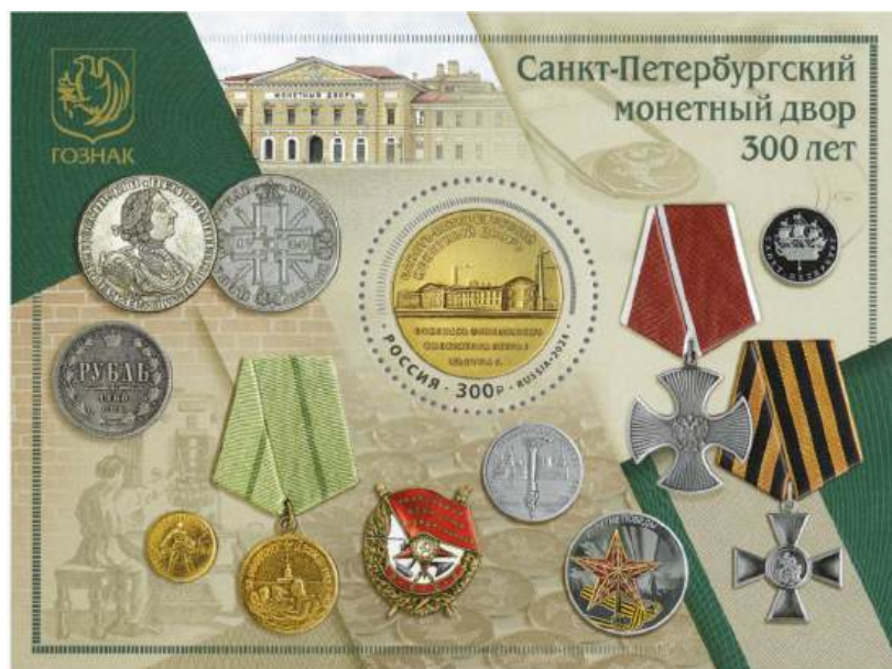
Рис. 14. Почтовый блок России «300 лет СПМД» 2024

В январе 2024 тиражом 18 тыс. экземпляров выпущен почтовый блок в честь 300-летия Санкт-Петербургского монетного двора 30 (рис. 14).