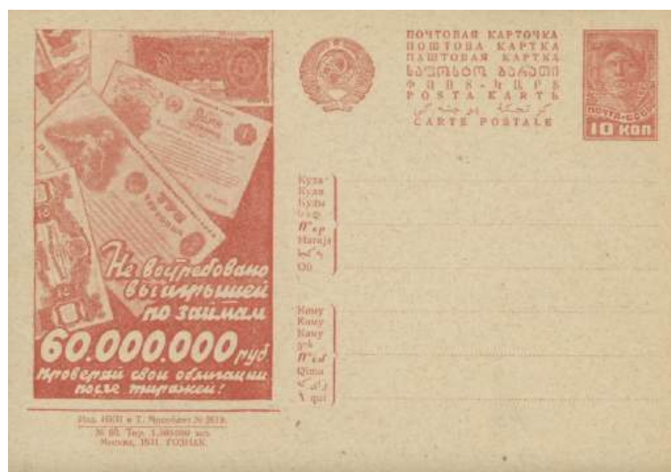
Рис. 2.2. Почтовая карточка СССР «Не востребовано выигрышей по займам...» 1931 с изображением банковских билетов в 5, 10, 20 и 30 рублей 1924-28

Изображения монет на непочтовых марках отсутствуют (Недайводин 2007).