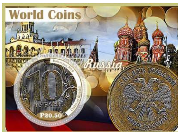
Рис. 22.5. Непочтовый блок «Монеты России» 2019 под именем Ботсваны