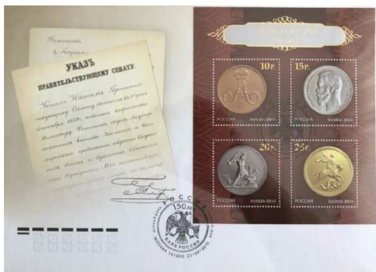
Рис. 11.1. КПД России «150 лет Банку России» 2010