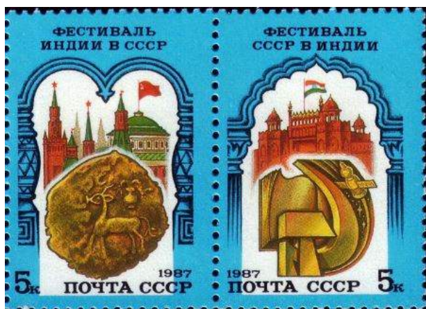
Рис. 4. Сценка из 2 почтовых марок СССР «Фестивали советско-индийской дружбы» 1987

На почтовой марке «Фестиваль Индии в СССР, приуроченный к 40-летию независимости Индии» изображена медная монета Яудхеи 16 (II век) на фоне ансамбля московского Кремля в обрамлении арки в русском национальном стиле (рис. 4).