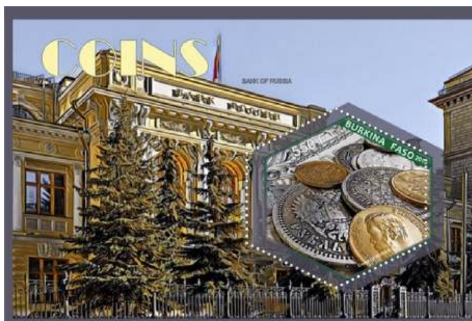
Рис. 22.1. Непочтовый блок «Монеты России» 2015 под именем Буркина-Фасо