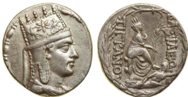
Рис. 5.4. Серебряная тетрадрахма Тиграна II Великого (I век до н.э.)

Бронзовые и серебряные монеты Тиграна II чеканили в столице государства Селевкидов, Антиохии на Оронте, после завоевания Сирии в I веке до н.э. (рис. 5.4).