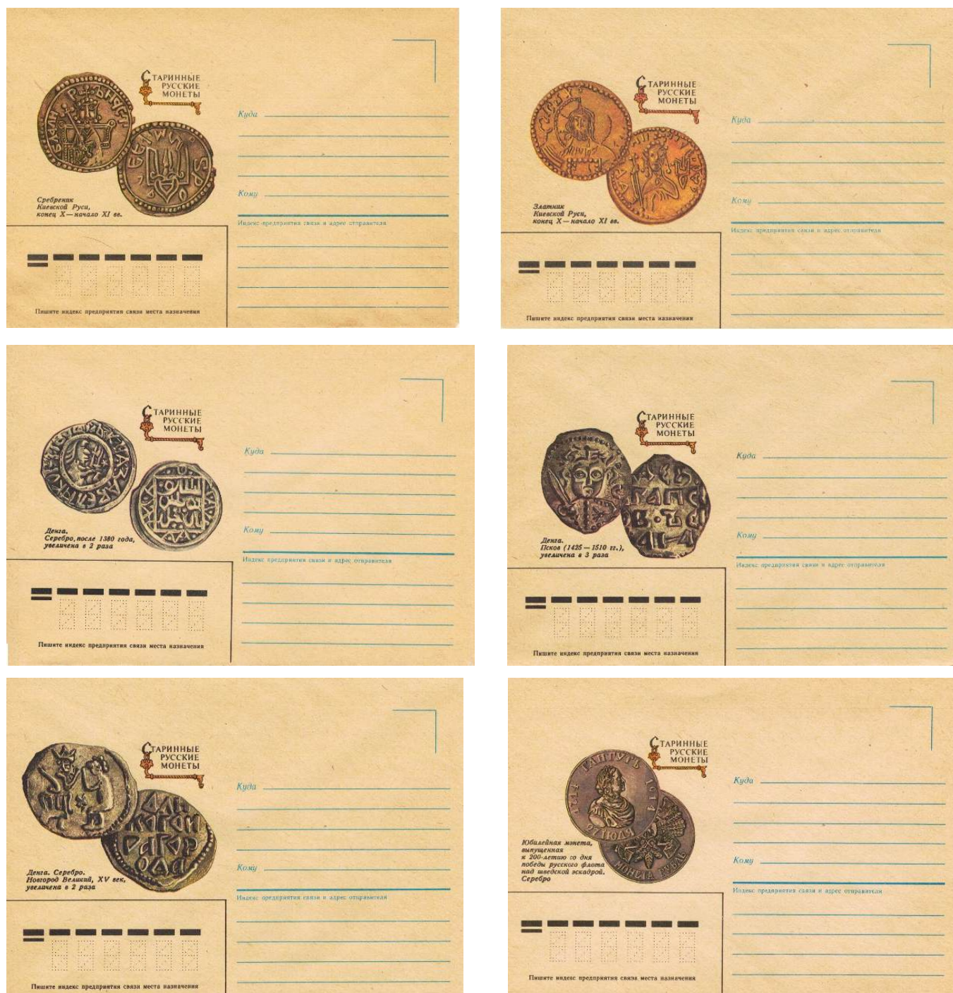
Рис. 3. Серия ХНК СССР «Старинные русские монеты» 1986

В 1986 была выпущена серия «Старинные русские монеты» из 6 художественных немаркированных конвертов (ХНК) 13 (рис. 3).