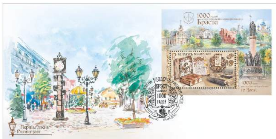
Рис. 16.1. КПД Белоруссии «1000 лет первому письменному упоминанию Бреста» 2019

На почтовой марке с литерным номиналом «Р» 40 изображены несколько медных солидов («боратинок») 41 Великого княжества Литовского 1665-66.