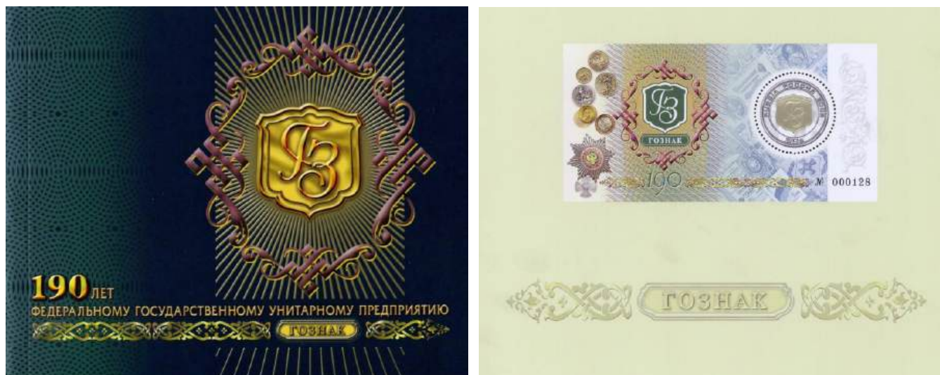
Рис. 9.2. Обложка памятного буклета и вариант почтового блока России «190 лет Гознаку России» 2008

В основной тираж почтовой марки вошли 10 тысяч юбилейных буклетов. Каждый из них включал отпечатанный на марочной бумаге лист, содержащий номерной блок с начальной нумерацией (Петраков 2008) (рис. 9.2).