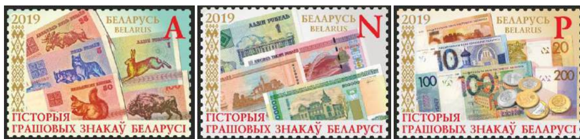
Рис. 17. Почтовые марки Белоруссии «История денежных знаков Белоруссии» 2019

В ноябре 2019 выпущена тематическая серия «История денежных знаков Белоруссии» из 3 почтовых марок тиражом 72 тыс. экземпляров, 4 малых листов тиражом 15 тыс. штук и 3 карт-максимумов 42 (рис. 17).