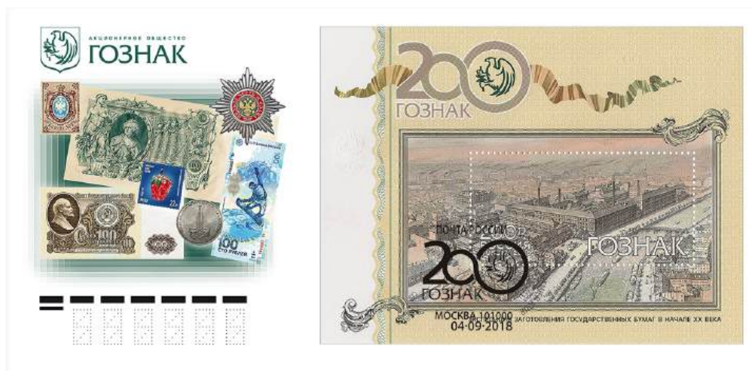
Рис. 13.1. КПД России «200 лет Гознаку России» 2018

На почтовой марке и полях блока изображены корпуса Экспедиции заготовления государственных бумаг (ЭЗГБ) в начале XX века.