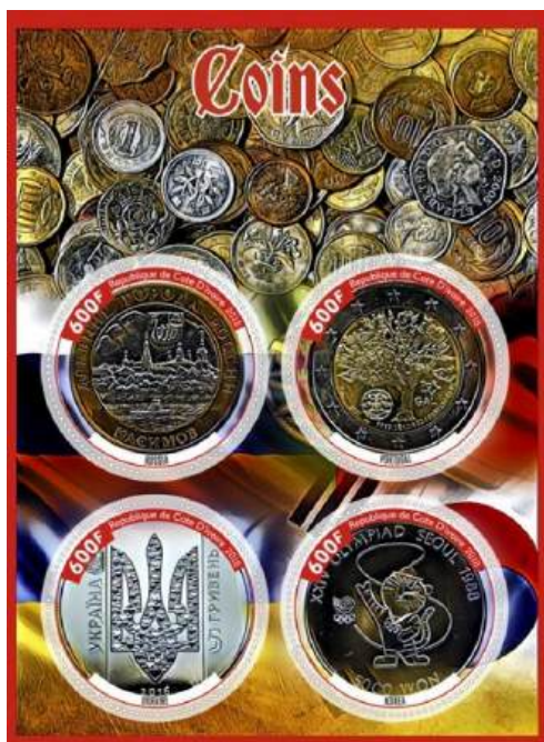
Рис. 22.3. Непочтовый блок «Монеты» 2015 под именем Кот д'Ивуар