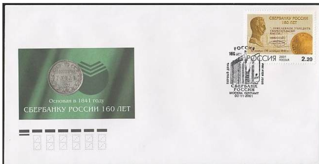
Рис. 7.1. КПД России «160 лет Сбербанку России» 2001

На марке изображена золотая монета Николая I 1841 номиналом 5 рублей, на КПД - серебряный рубль Николая I 1841 (рис. 7.1).