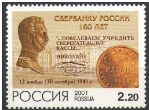
Рис. 7. Почтовая марка России «160 лет Сбербанку России» 2001

Первые сберегательные кассы основаны в России в 1841 Указом императора Николая I и открылись в 1842 при Московской и Санкт-Петербургской сохранных казнах. Сегодня Сбербанк — крупнейший банк в России, Центральной и Восточной Европе, один из ведущих международных финансовых институтов.