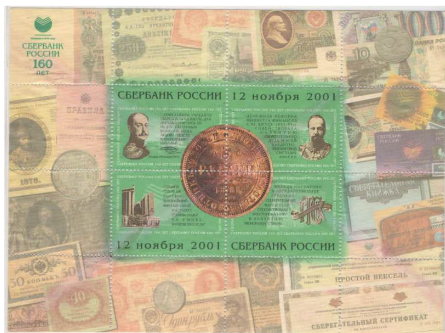
Рис. 7.2. Листок с виньетками «160 лет Сбербанку России» 2001

В том же 2001 издательско-торговый центр «Марка» выпустил памятный листок с 4 виньетками, в центре которого изображена упомянутая выше золотая монета. На полях листа изображены монеты России и СССР разных периодов (рис. 7.2).