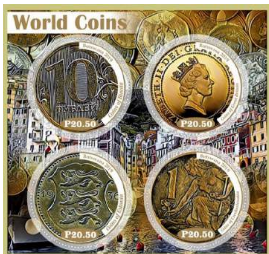
Рис. 22.4. Непочтовый блок «Монеты мира» 2019 под именем Ботсваны