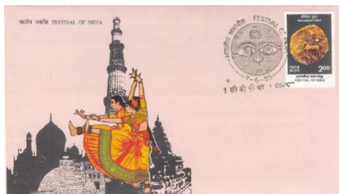
Рис. 4.2. КПД Индии «Монета Яудхеи. Фестиваль Индии» 18 1985

Олень на аверсе монеты олицетворяет принцип «ахимсы» или ненасилия. Слева от оленя изображен храм бога войны Картикеи. Над оленем - «калаш», ритуальный горшок изобилия, и символ «шри», приносящий процветание и благополучие. На реверсе