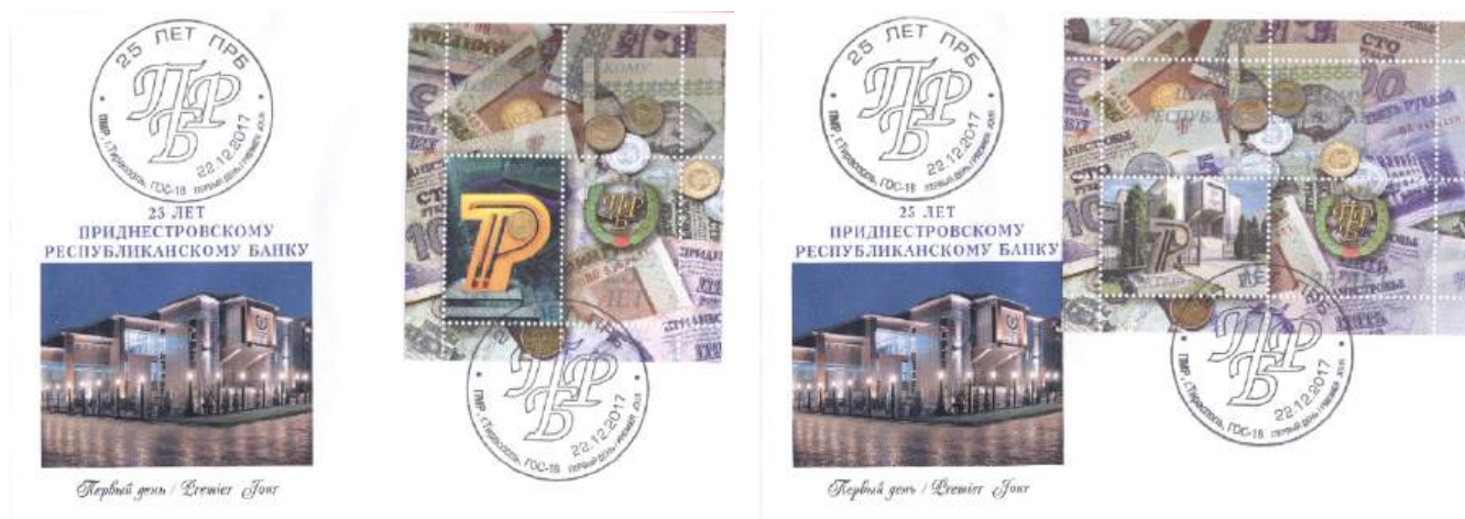
Рис. 18.2. КПД ПМР «25 лет Приднестровскому Республиканскому Банку» 2017

На КПД помещена ночная фотография здания ПРБ, сделанная еще в 2006-2007 (рис. 18.2).