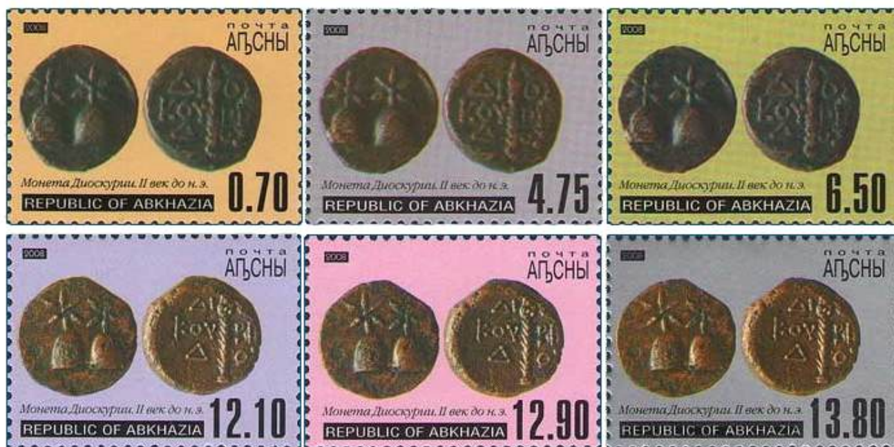
Рис. 15. Почтовые марки Абхазии «Монеты Диоскуриады» 2008

В апреле 2008 Национальный Банк Республики Абхазия (НБ РА) получил право эмиссии национальной валюты – апсара, а в декабре того же года была выпущена серия из 6 почтовых марок с изображением 2 монет древней Диоскуриады 34 (рис. 15).