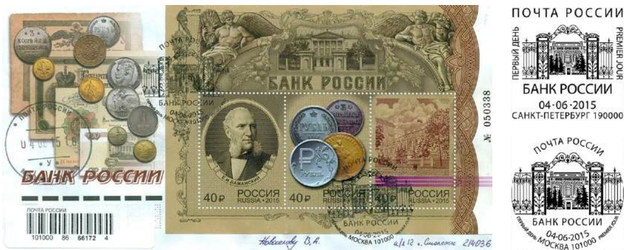
Рис. 12.1. КПД России «155 лет Банку России» 2015 и 2 варианта штемпеля

На поле КПД изображены российские и советские монеты XX века (рис. 12.1).