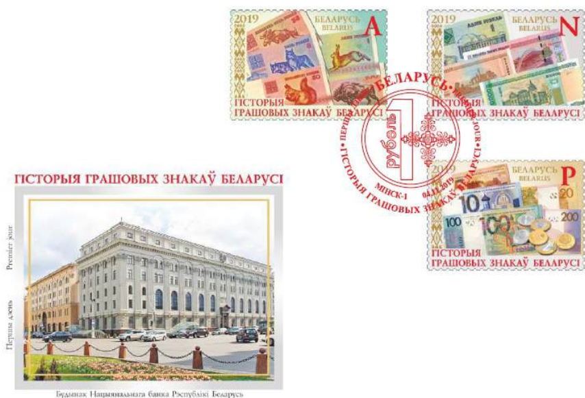
Рис. 17.1. КПД Белоруссии «История денежных знаков Белоруссии» 2019

На почтовой марке с литерным номиналом «Р» 43 изображены современные монеты Белоруссии 50 копеек, 1 и 2 рубля образца 2009.