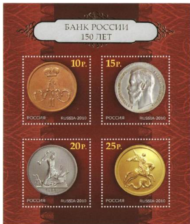
Рис. 11. Почтовый блок России «150 лет Банку России» 2010

В сентябре 2010 тиражом 120 тыс. экземпляров выпущен почтовый блок в честь 150-летия Банка России 27 (рис. 11). Государственный банк Российской империи был основан в 1860 Указом императора Александра II в целях упрочения денежной кредитной системы. В настоящее время преемником банка является Центральный банк Российской Федерации.