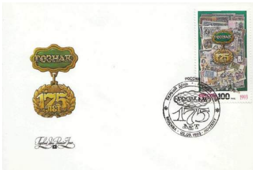
Рис. 6.1. КПД России «175 лет Гознаку» 1993

На марке изображены российские и советские монеты разных периодов XX века.