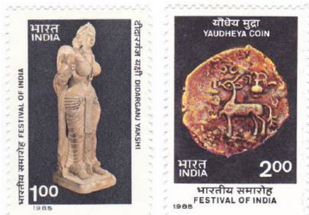
Рис. 4.1. Почтовые марки Индии «Якшини из Дидарганджа» и «Монета Яудхеи» 1985

Эта редкая монета стала эмблемой фестиваля Индии ещё в 1985, когда он проходил во Франции и США, поэтому её можно увидеть на почтовой марке Индии 17 (рис. 4.1 и 4.2).