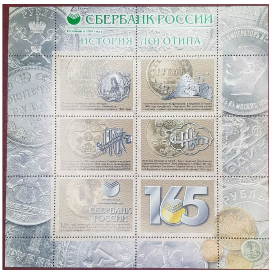
Рис. 7.3. Листок с виньетками «165 лет Сбербанку России. История логотипа» 2006

Через 5 лет в 2006 в честь 165-летия Сбербанка были выпущены 2 подобных памятных листка с виньетками. Один из них посвящен истории логотипа Сбербанка. На виньетках и полях листка изображены российские и советские монеты разных периодов (рис. 7.3).