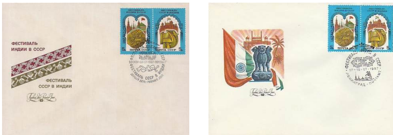
Рис. 4.3. Варианты КПД СССР «Фестивали советско-индийской дружбы» 1987

Были выпущены открытки, почтовые карточки, конверты первого дня (КПД) (рис. 4.3) и художественные маркированные конверты (ХМК) с символикой некоторых городов-участников фестиваля (Москва, Ленинград, Ташкент) 19 (рис. 4.4). В каждом из 3 городов-участников использовался свой вариант штемпеля черного цвета, а в Москве – дополнительный штемпель красного цвета к открытию фестиваля.