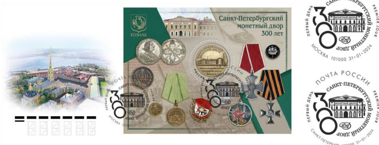
Рис. 14.1. КПД России «300 лет СПМД» 2024 и 2 варианта штемпеля

На КПД изображен вид на корпуса Санкт-Петербургского монетного двора, штемпель черного цвета представлен в 2 вариантах – для Москвы и Санкт-Петербурга (рис. 14.1).