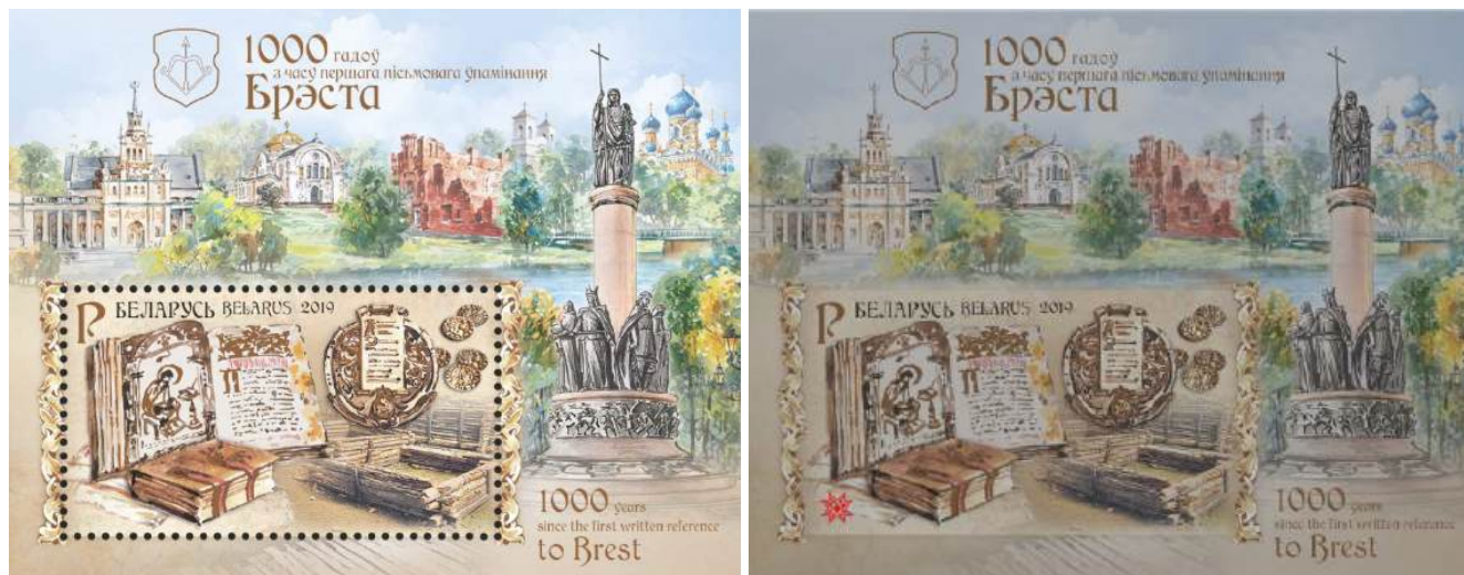
Рис. 16. Почтовый блок 39 Белоруссии «1000 лет первому письменному упоминанию Бреста» 2019

В сентябре 2019 тиражом 20 тыс. экземпляров выпущен почтовый блок в честь 1000-летия со времени первого письменного упоминания Бреста (Белоруссия) 38 (рис. 16 и 16.1).