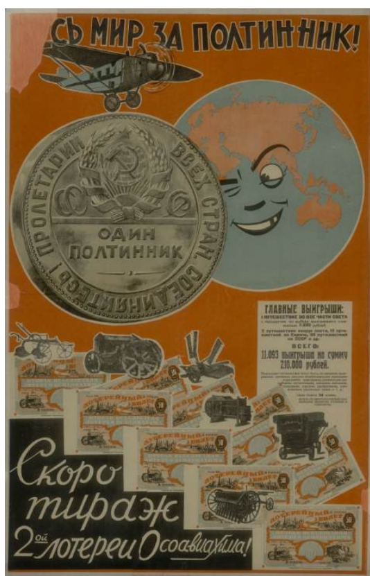
Рис. 2.1. Агитационный плакат СССР «Весь мир за полтинник!» 1928 с изображением серебряного полтинника (50 копеек) СССР 1924-27

Тем не менее, авторы дизайна советских агитационных плакатов, открыток и почтовых карточек 1920-30-х годов, разъясняющих и пропагандирующих преимущества сберегательных вкладов и денежно-вещевых лотерей, старались обходиться без изображений монет и банковских билетов. Они встречаются лишь изредка (рис. 2.1-2.2) 12 .