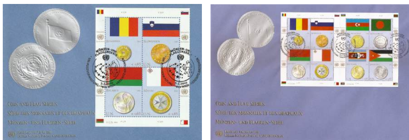
Рис. 20.1. Варианты КПД ООН «Монеты и флаги» 2010

Выпущены КПД 2 типов: с почтовым блоком из 4 марок, с мини-блоком из 8 марок (рис. 20.1).