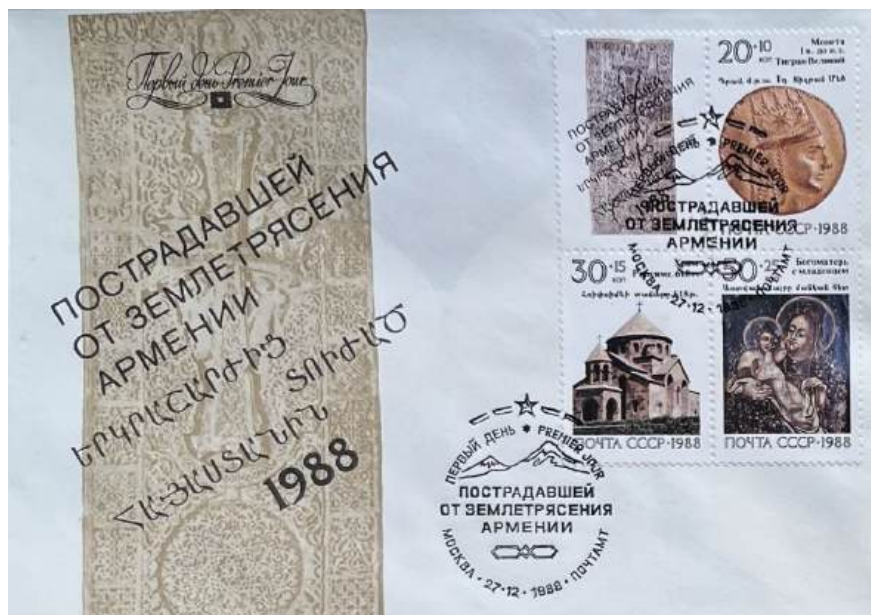
Рис. 5.2. КПД СССР «Реликвии армянского народа» 1988