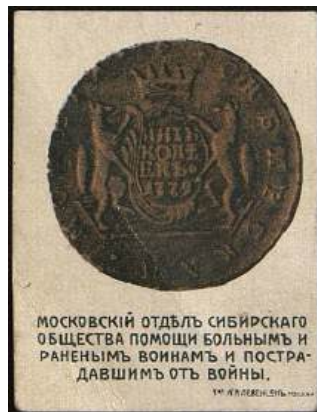
Рис. 1.2. Виньетка «5 копеек 1779» 1915 (из коллекции ГИМ 10 )