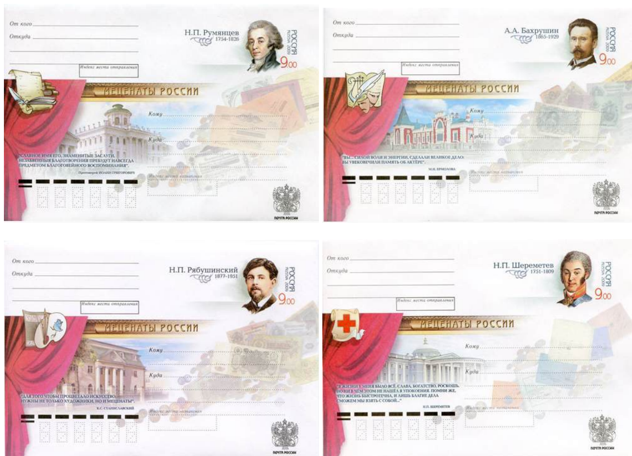
Рис. 10.2. Серия ХМК России «Благотворители и меценаты России» 2009

Тираж 4 ХМК, выпущенных в 2009, уменьшен до 57 тыс. экземпляров, а номинал марок вырос до 9 рублей.