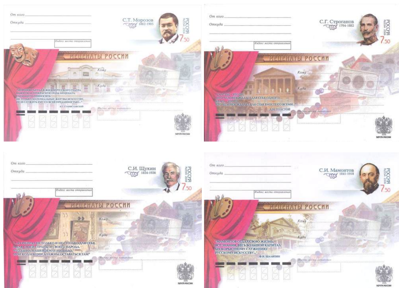
Рис. 10.1. Серия ХМК России «Благотворители и меценаты России» 2008

Тираж 4 ХМК, выпущенных в 2008, составил 105 тыс. экземпляров, номинал марок – 7.5 рублей.