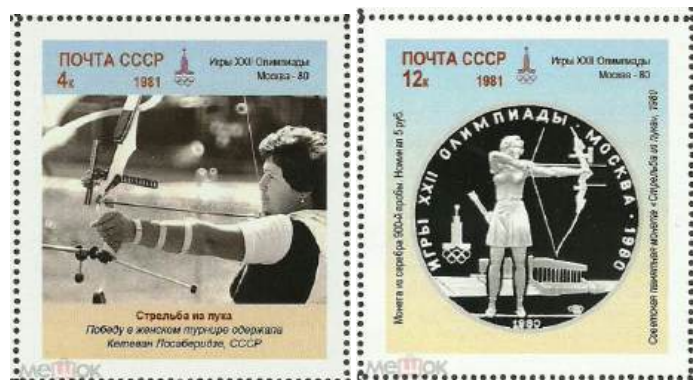
Рис. 21. Непочтовые марки серии «Игры XXII Олимпиады. Москва. 1980» 1981 под именем СССР

На некоторых марках серии изображены серебряные монеты СССР номиналом 5 и 10 рублей, а также платиновые монеты номиналом 150 рублей 1978-80 из серии «Игры XXII Олимпиады. Москва. 1980» (рис. 21).