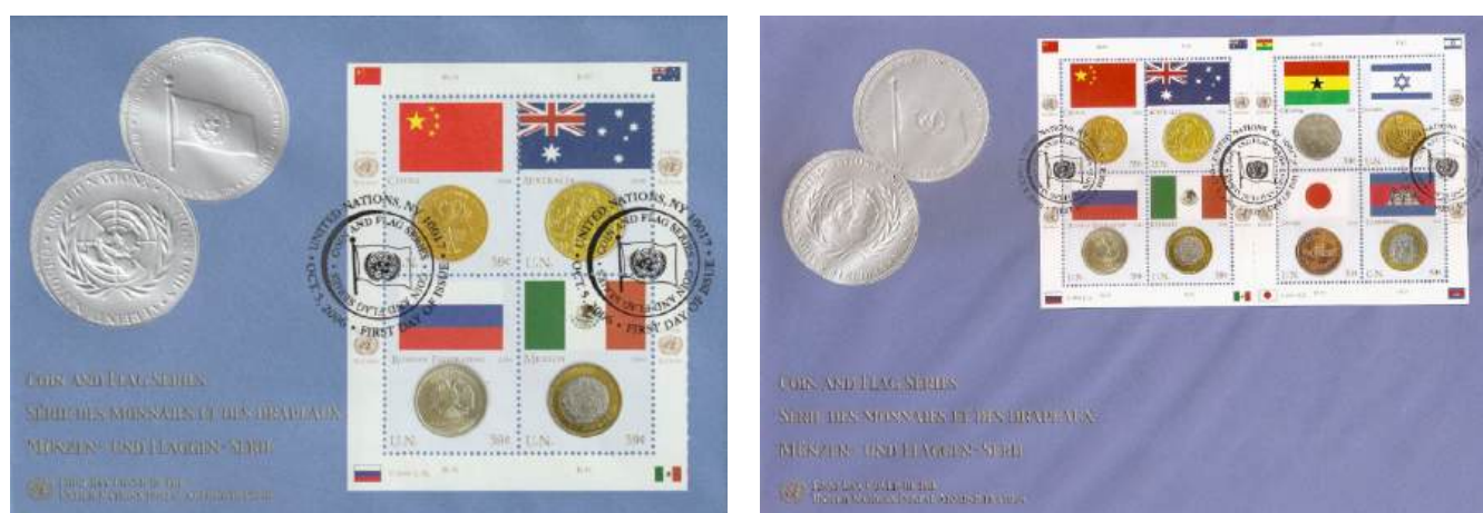
Рис. 19.1. Варианты КПД ООН «Монеты и флаги» 2006

Выпущены КПД 2 типов: с почтовым блоком из 4 марок, с малым листом из 8 марок (рис. 19.1).