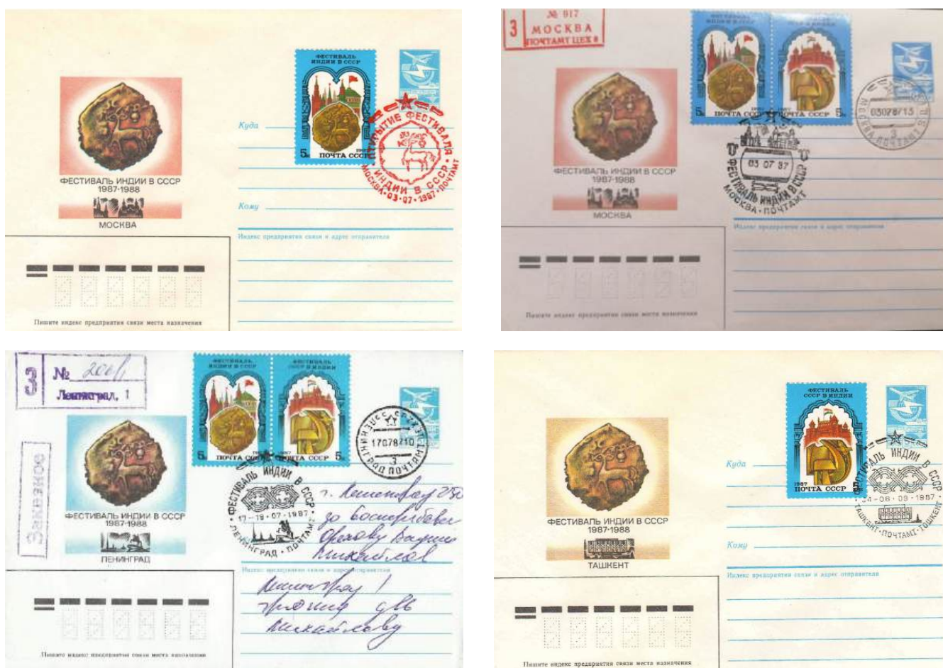
Рис. 4.4. Варианты ХМК СССР «Фестивали советско-индийской дружбы» 1987