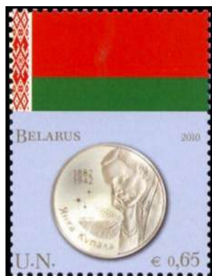
Рис. 20. Почтовая марка ООН «Монеты и флаги. Белоруссия» 2010

В феврале 2010 в Вене тиражом по 88 тыс. экземпляров выпущены 8 почтовых марок с изображениями национальных флагов и монет Азербайджана, Бангладеш, Белоруссии, Иордании, Мальты, Румынии, Свазиленда и Словении.