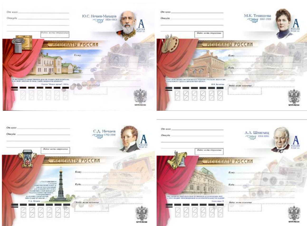
Рис. 10.4. Серия ХМК России «Благотворители и меценаты России» 2011

Для 4 ХМК, выпущенных в 2011, марка получила литерный номинал «А» 26 , что позволило увеличить тираж каждого конверта до 500 тыс. экземпляров.