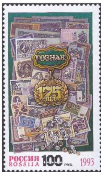
Рис. 6. Почтовая марка России «175 лет Гознаку» 1993

Сейчас Гознак России - крупнейшее государственное предприятие по производству государственных знаков, специальных видов бумаги, банкнот, бланков документов и ценных бумаг, акцизных, специальных и почтовых марок, монет, орденов и медалей.