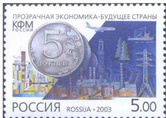
Рис. 8. Почтовая марка России «Комитет РФ по финансовому мониторингу» 2003

Этой деятельностью с 2001 занимается Комитет Российской Федерации по финансовому мониторингу (КФМ России). В 2004 КФМ преобразован в Федеральную службу по финансовому мониторингу (Росфинмониторинг).