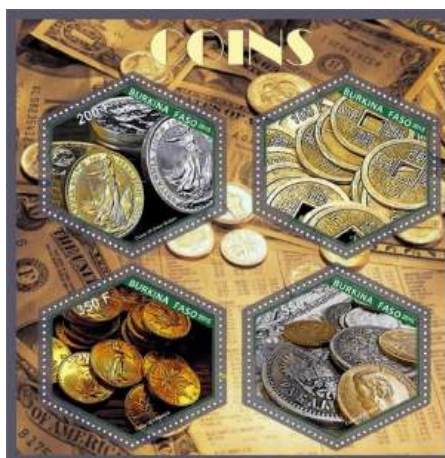
Рис. 22.2. Непочтовый блок «Монеты» 2015 под именем Буркина-Фасо