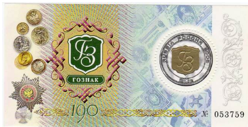
Рис. 9. Почтовый блок России «190 лет Гознаку России» 2008

В сентябре 2008 тиражом 120 тыс. экземпляров выпущен почтовый блок в честь 190-летия Гознака России 24 . Форма почтового блока напоминает денежную купюру (рис. 9).