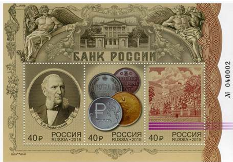
Рис. 12. Почтовый блок России «155 лет Банку России» 2015

В июне 2015 тиражом 70 тыс. экземпляров выпущен почтовый блок в честь 155-летия Банка России 28 (рис. 12).