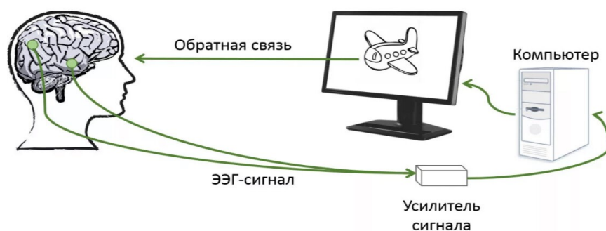
Схема действия БОС-ТЕРАПИИ(смысловая схема):

Классическая БОС-терапия использует обратную связь от мышц мышечной системы пациента. Эта обратная связь фиксируется сознанием пациента, и далее пациент сознательно оперирует этой обратной связью, конкретнее — информацией, которая предоставляется этой обратной связью. Эта информация используется с целью коррекции паттернов движения конечностей и/или отдельных мышц в частности.