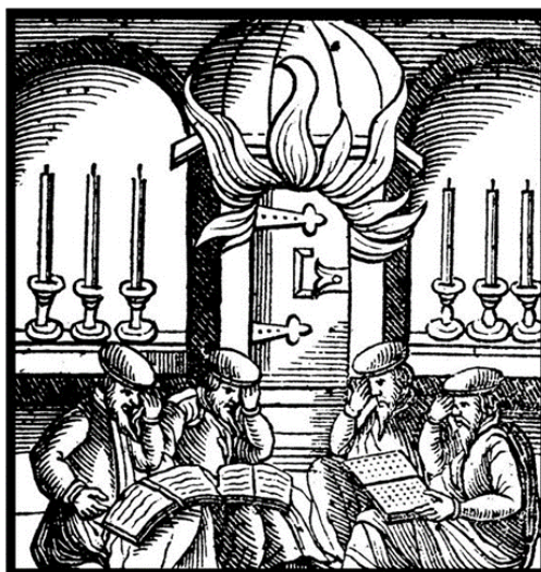
Фото 1: «Книга обычаев» («СЕФЕРhА МИНАГИМ»). Гравюра. Амстердам.

Ключевые слова: квантовая телепортация, запутанность, сцепленность, измерение состояний Белла, нозологическая форма, реконвалесценция, макроскопическая телепортация, микротрубочки, объективная редукция.