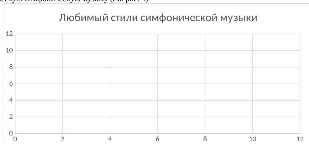
Рисунок 4. Любимый жанр симфонической музыки.

На вопрос об отношении к музыке входящий в плейлист участников наиболее популярным был ответ: «В моем плейлисте много музыки различных жанров» (77,8%). Такая же доля участников ответила: «Хорошая музыка всегда актуальна» (77,8%). При этом участники, рожденные после 2000 года, актуальной назвали музыку 1970-1980-х гг. (4,5%), а также 1990-х (7,1%). Вопреки расхожему мнению поколение Z принимает классическую симфоническую музыку (см. рис. 4)