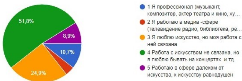
Рис. 2. Род деятельности участников опроса по отношению к искусству.

Интерес к искусству у большинства участников опроса объясняется тем, что с распространением цифровых технологий искусство становится доступным для самых широких слоев населения. Не только пассивное созерцание, но и широкое обсуждение в социальных сетях и оценка живописного и музыкального материала. Другим важным фактором проявления большинством интереса к искусству, творчеству в целом, есть наличие существенной доли творческого труда в современной производственной деятельности. Искусство рассматривается как одна из областей профессионального творческого труда, то есть часть повседневной для человека креативной сферы деятельности. Информационное/цифровое общество сняло покров сакральности с искусства. Доступность музыки и живописи в их цифровых проекциях, возможность сотворчества, возможность каждого человека, ограниченная лишь его желаниями и возможностями создавать произведения искусства и распространять на неограниченный круг лиц.