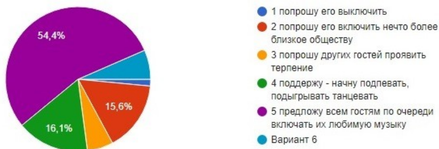
Рис. 3. Ситуационная задача: на вечеринке один из гостей включил запись музыкального произведения не популярного у других гостей. Вы скорее всего...

Автор ожидал, что молодежная аудитория ответит негодованием на действия «гостя». Но, как показано на рисунке №3, наибольшее число ответов связано именно с нейтральной (предложу всем гостям по очереди включить их любимую музыку – 54,4 %) или позитивной (поддержку – начну подпевать, подыгрывать, танцевать 16,1%) реакцией. Меньшинство, то есть около 20 % высказывают скорее негативную реакцию (15,6 % выбрали ответ «я попрошу его включить нечто более близкое обществу», а 5,8% предполагают попросить других гостей «проявить терпение»). Экстраполируя распределение реакций участников, можно сказать, что большинство молодых людей воспринимает произведение музыкального, изобразительного искусства без проявления неприязни к какому-то стилю, что касается не только жанров современной популярной, но и классической музыки. Это подтверждает и выбор ответов на другие вопросы анкеты.