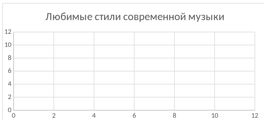
Рис. 5 Любимый стиль современной музыки. 1. Джаз; 2. Рок; 3. Хеви – металл; 4. Панк-рок; 5. Фолк-рок; 6. Рэп; 7. Поп – музыка; 8. Этническая музыка; 9. Этническая музыка моего этноса.

В области современной музыки (см. рис. 5) ожидаемо наибольшую долю заняла поп-музыка, как наиболее массовое направление (67,3%), на втором месте рэп (45,6%). Такая большая доля поклонников стиля рэп связана как с популярным исполнителем А. Моргенштерн – земляком уфимских студентов, так и с тем, что зарождение и развитие этого стиля наиболее близко к поколению Z. Однако другие направления современной музыки также вызывают интерес. Рокк -37%, джаз -26, 6%, этническая музыка – 16,7%. В анализе ответов отдельных участников, выбравших несколько направлений не выявлено сколь бы то существенной корреляции с предпочтениями и ценностями. Участники одновременно отмечают рокк и рэп, джаз и этническую музыку и др.