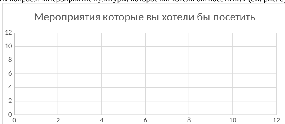
Рис. 6. После отмены режима ограничения на проведение массовых мероприятий какое мероприятия вы хотели бы посетить в первую очередь. 1. концерт симфонической музыки; 2. Классическую оперу или балет; 3. Вечер джазовой музыки; 4. Рок-концерт; 5. Концерт поп-музыки; 6. Музей классической живописи и скульптуры; 7. Музей современного искусства.

Ограничения на посещения мероприятий, введенных в связи с пандемией Covid19, наложили отпечаток на ответы вопроса: «Мероприятие культуры, которое вы хотели бы посетить?» (см. рис. 6).