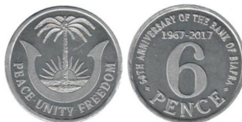
Рис. 6.2. 6 пенсов 2017

В 2017-2021 была выпущена очередная серия из 9 токенов с фауной Азии и Африки 35 : азиатский и африканский слоны, леопардовая черепаха, горилла, лев, белый носорог, зебра, страус, одногорбый верблюд.