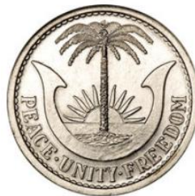
Рис. 4.2. 1 шиллинг 1969