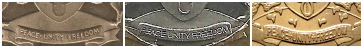
Рис. 7.2. Элемент герба на токенах под именем Biaфры 2012-2021

На токенах элементы либо отсутствуют, либо представляют собой 6 цветков: