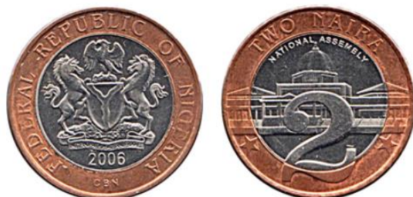
Рис. 5.2. 2 найры 2006

С первой серии 1958 наименование номинала на банкнотах традиционно дублируется на аджаме - арабографическом письме, которое использует народ хауса (Falola 2009).