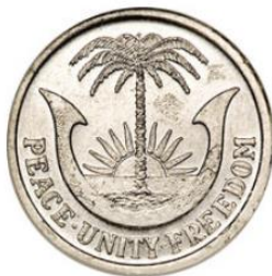
Рис. 4.1. 3 пенса 1969

Ориентировочно в феврале 1969 в обращение на территории Биафры введены банкноты второй серии: 5 и 10 шиллингов, 1, 5 и 10 фунтов. Они были защищены значительно лучше 20 , и отпечатаны предположительно компанией Markpress (Biafran Overseas Press Division) (Швейцария).