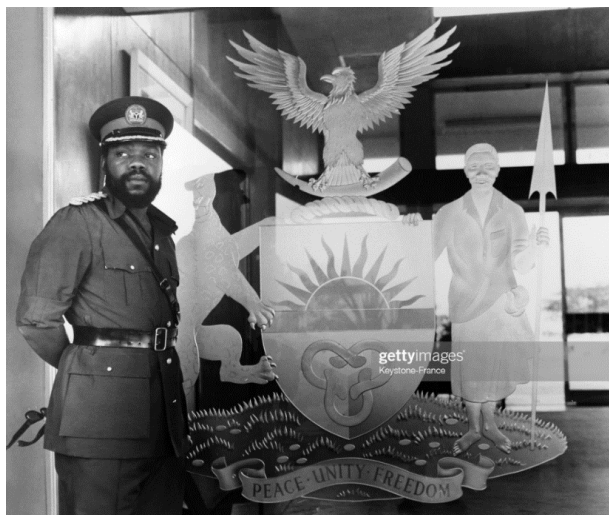
Рис. 7.3. Ч. Одумегву-Оджукву на фоне герба Восточной Нигерии 38

Официальный герб Biaфры в своей основе содержит герб Восточной Нигерии 1960 37 :