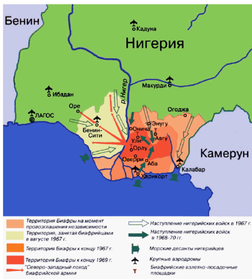
Рис. 4. Боевые действия во время гражданской войны в Нигерии (Жирохов 2002).

Руководство Биафры проводило параллели между борьбой игбо за независимость от Нигерии с борьбой за выживание государства Израиль 13 : чтобы не только сплотить разнородное полиэтничное население, но и оказать воздействие на мировое сообщество. На стороне Биафры, гласно или негласно, были Франция 14 , Португалия, ЮАР, КНР, Израиль.