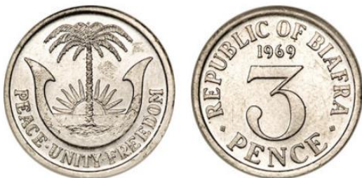
Рис. 4.1. 3 пенса 1969

Ограниченным тиражом ориентировочно до 20 штук были отчеканены монеты в 6 пенсов и 1 шиллинг 41 , которые в денежном обращении практически не встречались.