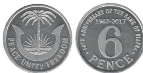
Рис. 6.2. 6 пенсов 2017

В 2012 состоялся выпуск первого токена в честь 45-летия создания Банка Биафры. Якобы он санкционирован т.н. Правительством Биафры в изгнании (BGIE) 55 . В сюжете токена используются элементы дизайна монет Биафры 1969.