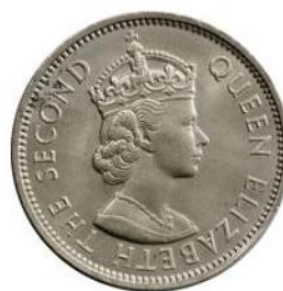
Рис. 3.2. 2 шиллинга 1959