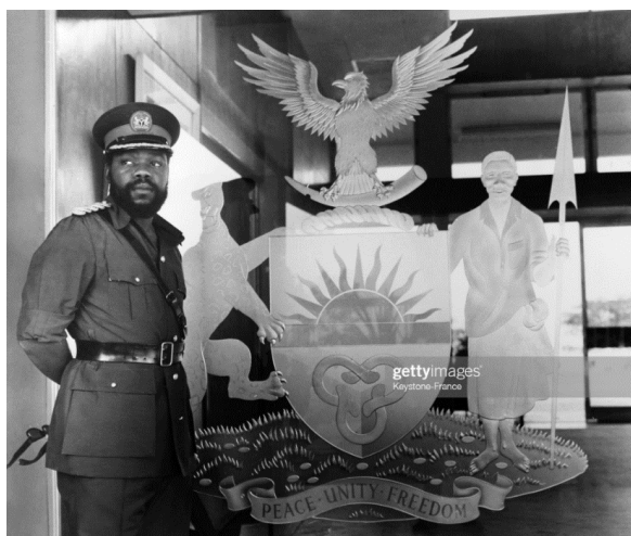
Рис. 7.1. Ч. Одумегву-Оджукву на фоне герба Восточной Нигерии 59

Заметно отличаются изображения герба. Официальный герб Биафры в своей основе содержит герб Восточной Нигерии 1960 58 :