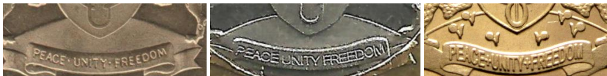
Рис. 7.5. Элемент герба на токенах под именем Биафры 2012-2021

На токенах элементы либо отсутствуют, либо представляют собой 6 цветков: