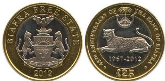
Рис. 6.1. 25 фунтов 2012

Как правило, серии токенов рассчитаны на спрос со стороны неискушенных коллекционеров монет в наиболее популярных сегментах: монеты с изображениями животного мира, биметаллические монеты, монеты необычного дизайна.