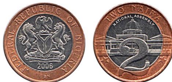
Рис. 5.2. 2 найры 2006

С первой серии 1958 наименование номинала на банкнотах традиционно дублируется на языке хауса в арабской графике (аджами) 46 .