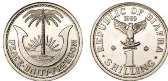
Рис. 4.2. 1 шиллинг 1969

Весной 1969 сепаратисты предприняли отчаянное, но неудачное контрнаступление. В июне 1969 федеральными войсками был захвачен аэродром Авгу, под контролем сил Биафры осталась единственная взлетно-посадочная полоса с твёрдым покрытием.