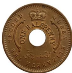
Рис. 3.1. ½ пенни 1959

В 1958 Нигерия перешла на использование нигерийского фунта стерлингов, который оставался национальной валютой до 1972. Нигерия использовала британскую двенадцатеричную денежную систему: 1 фунт состоял из 4 крон или 20 шиллингов, или 240 пенсов. Были выпущены банкноты в 10 шиллингов, 1 и 5 фунтов 12 . В 1959 была выпущена серия монет федеративной Нигерии номиналами ½ и 1 пенни, 3 и 6 пенсов, 1 и 2 шиллинга. На бронзовых монетах младших номиналов изображена «печать Соломона», на остальных – продукты традиционного экспорта Нигерии: хлопок, какао-бобы, кокосовые пальмы, арахис. Нефть была обнаружена на востоке Нигерии только в 1956 и еще не стала основой национального богатства страны.